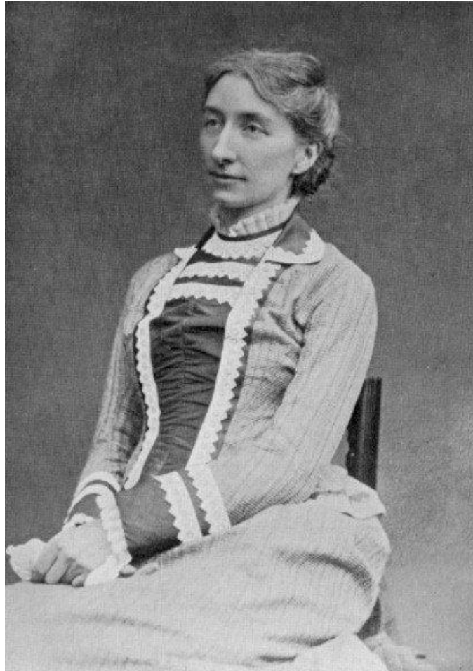
Cosima Wagner 1877

Wagner part s'installer en Suisse près de Lucerne et produit alors son opéra Les Maîtres chanteurs de Nuremberg achevé en 1867.