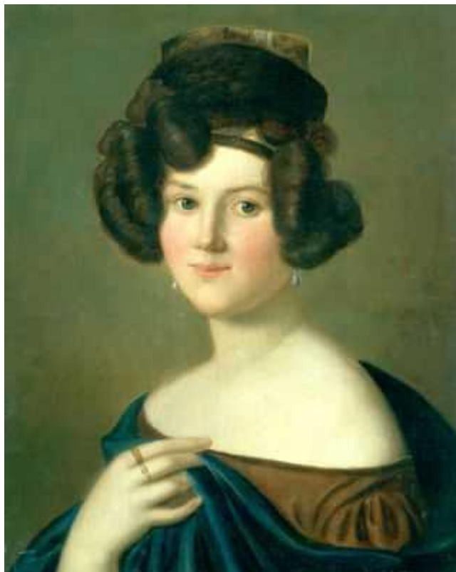
Minna 1 ère épouse de Wagner – en 1835