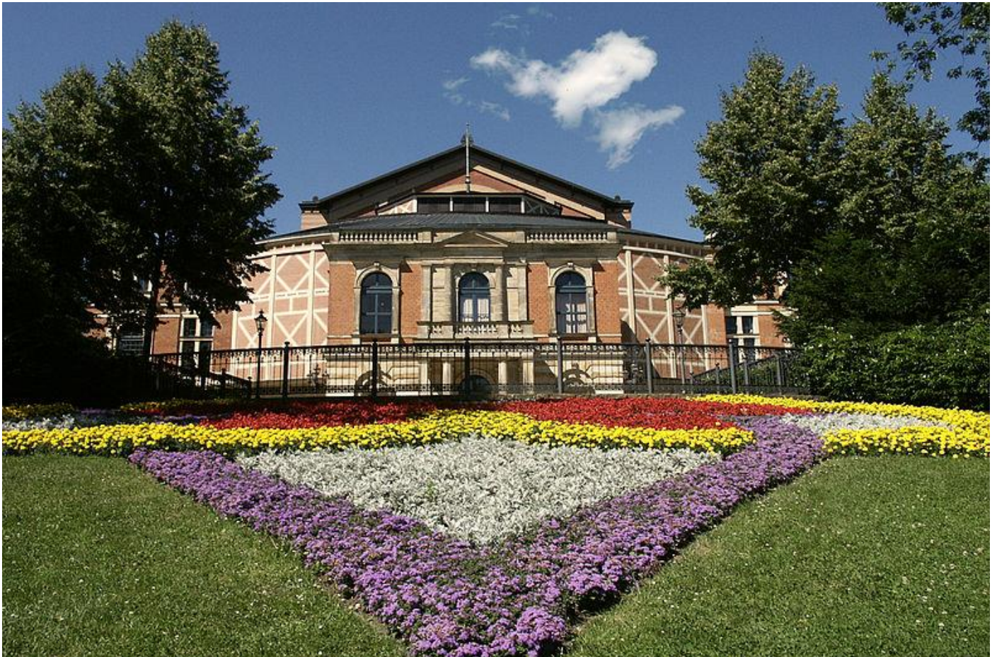
Palais des festivals conçu par Wagner à Bayreuth

Compositeur, directeur de théâtre, chef d'orchestre et polémiste, il se fait aussi philosophe et théoricien à travers plus d'une vingtaine d'ouvrages, au point que sa prodigieuse créativité impressionne encore ses biographes.