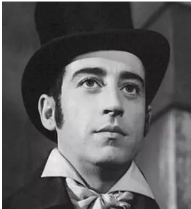
Pierre Vernier dans Rocamboles

Si on est entrés au Conservatoire, c'était pour faire du théâtre, le cinéma on n'y pensait pas beaucoup ", confiera-t-il en 2013 à Michel Drucker. Ainsi pendant plus de 50 ans et jusqu'en 2007, il est à l'affiche de 39 pièces de théâtre.