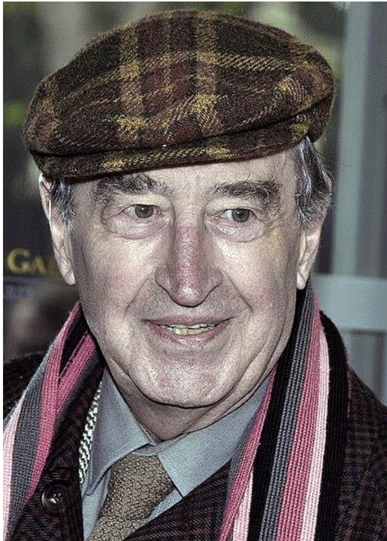
Pierre Vernier en 2013 dans Vivement dimanche

Le Conservatoire, c'était pour faire du théâtre, le cinéma on n'y pensait pas beaucoup !