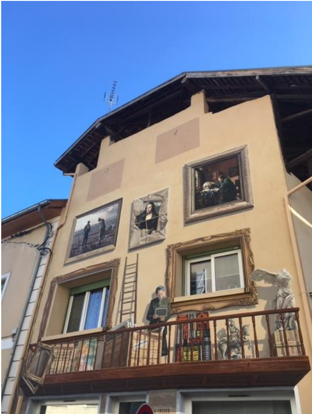
Fresque peinte en hommage à Rose Valland dans son village natal.