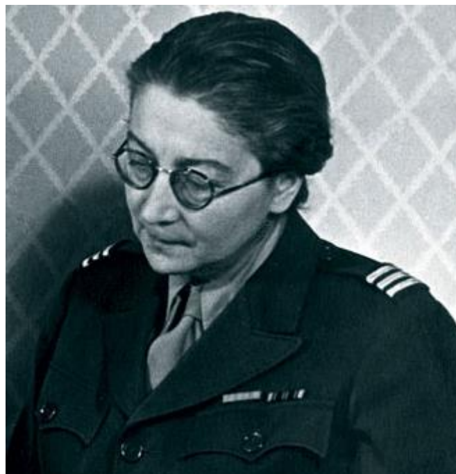
Capitaine Beaux-arts mène sa mission de justice jusqu'à sa mort

A l'automne 1944, elle communique aux Alliés les noms des dépôts allemands et autrichiens afin d'éviter les bombardements, les sécuriser et faciliter la récupération des œuvres entreposées.