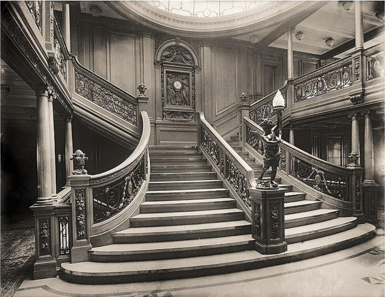
Grand escalier de la 1 ère classe du Titanic