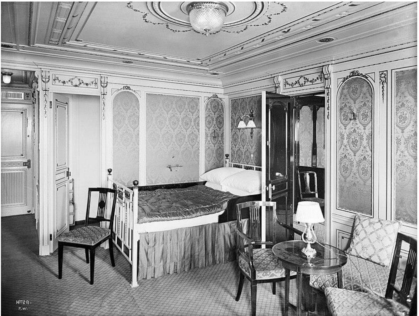
Une cabine de 1 ère classe du Titanic