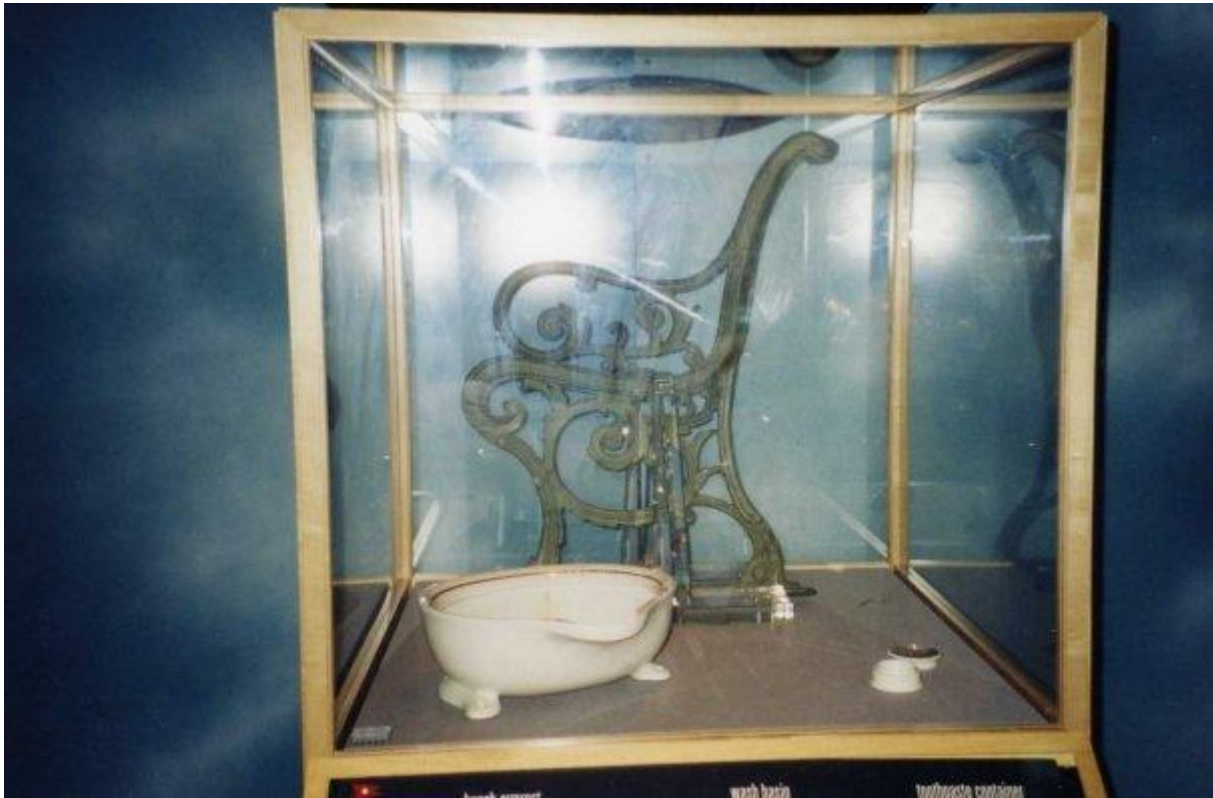
Des objets remontés du Titanic

Le Titanic, en héritier des Titans de la mythologie antique semble voué à demeurer dans les bas-fonds, gardiens de son illustre mystère.