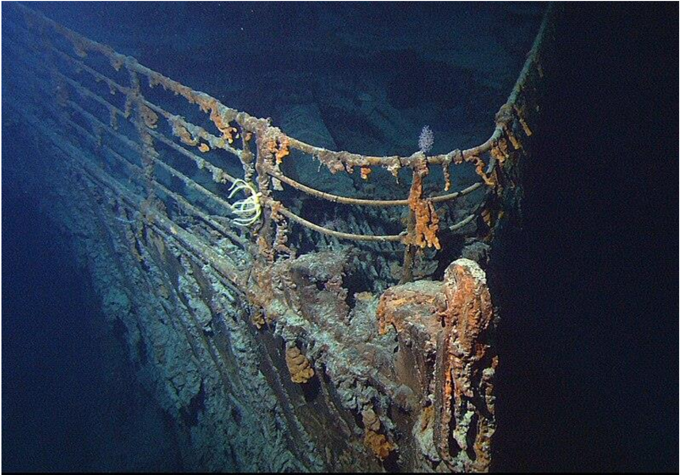
La proue du Titanic, vue depuis le ROV Hercules en juin 2004.

Son coffre-fort cachait 300 millions de dollars de bijoux. De la vaisselle en or et des crus millésimés... se trouvaient dans certaines cabines.