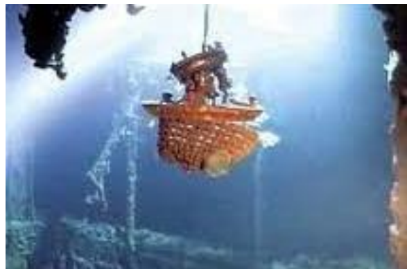
Lustres du Titanic plongés dans l'obscurité des fonds marins, témoins d'un luxe grandiose et éphémère.