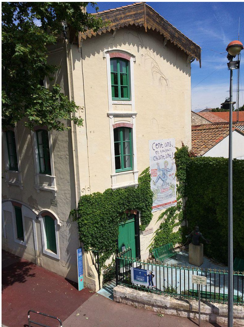
Maison natale de Trenet à Narbonne aujourd'hui ouverte au public