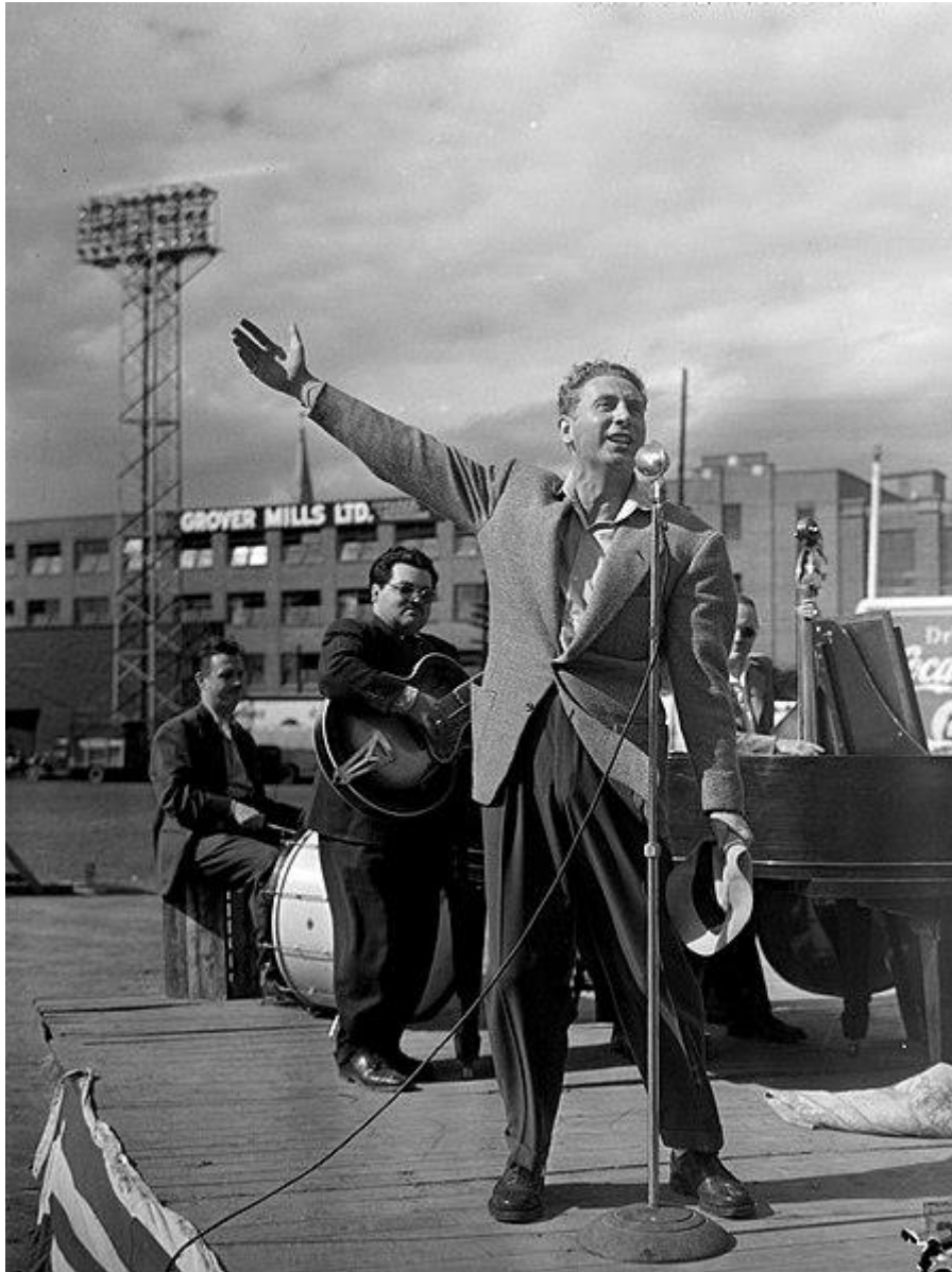
Trenet lors d'un spectacle donné à Montréal en 1946

les musiciens et poètes, il compose ses premières chansons et avec le pianiste de jazz Johnny Hess les voilà engagés grâce au soutien de Joséphine Baker , comme duettistes jusqu'en 1936.