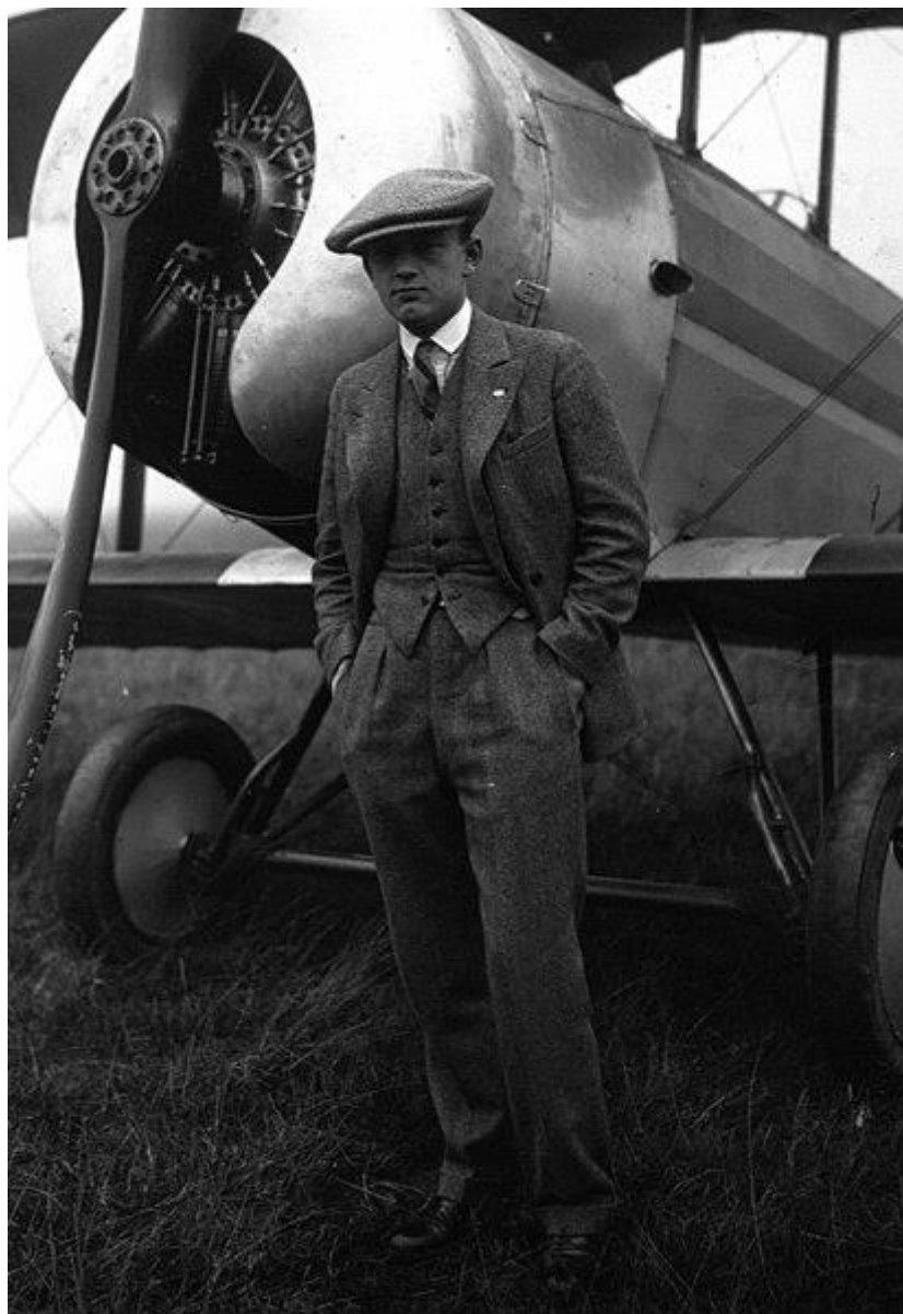
Roland Toutain, acrobate aérien, en 1926.

Plus tard, il devient l'ami d'écrivains et d'aventuriers tels que Joseph Kessel et Jean Mermoz .