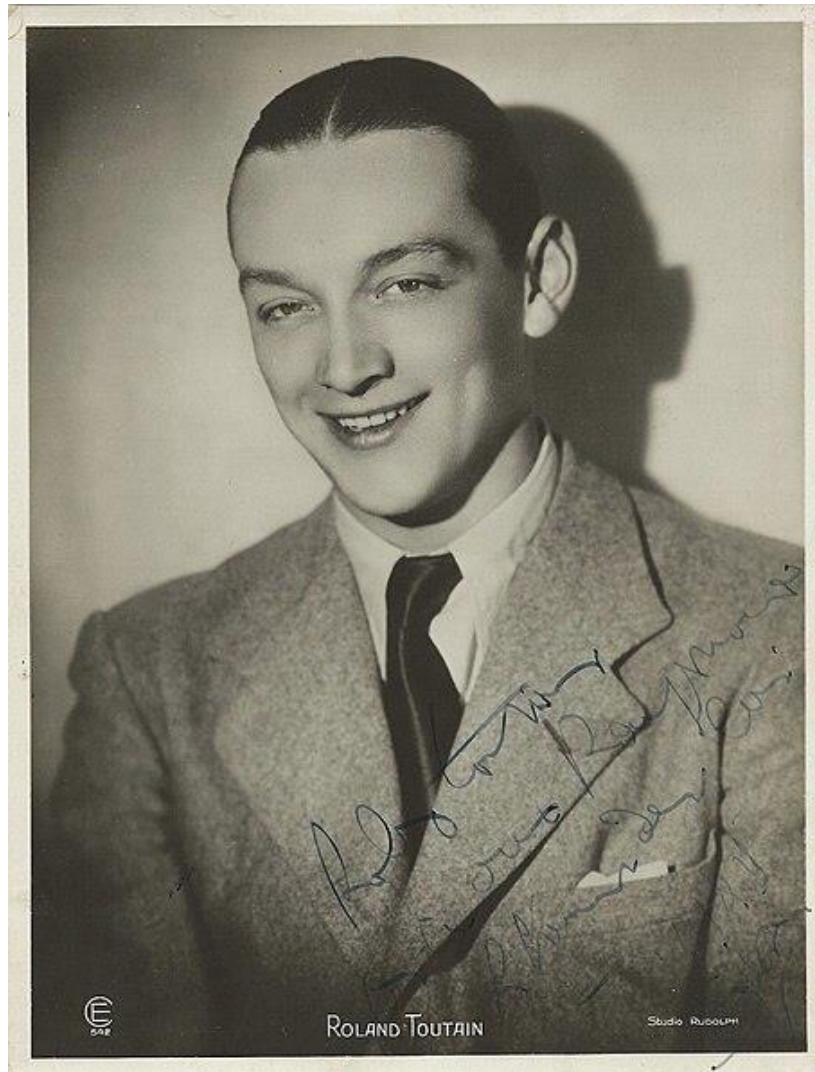
Carte postale Roland Toutain – années 1930

Décédé le 16 octobre 1977 à Argenteuil Val d'Oise 95