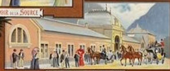
ETABLISSEMENT THERMAL DE SALINS