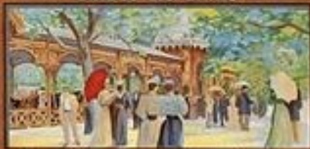
PROMENADE A LA SOURCE