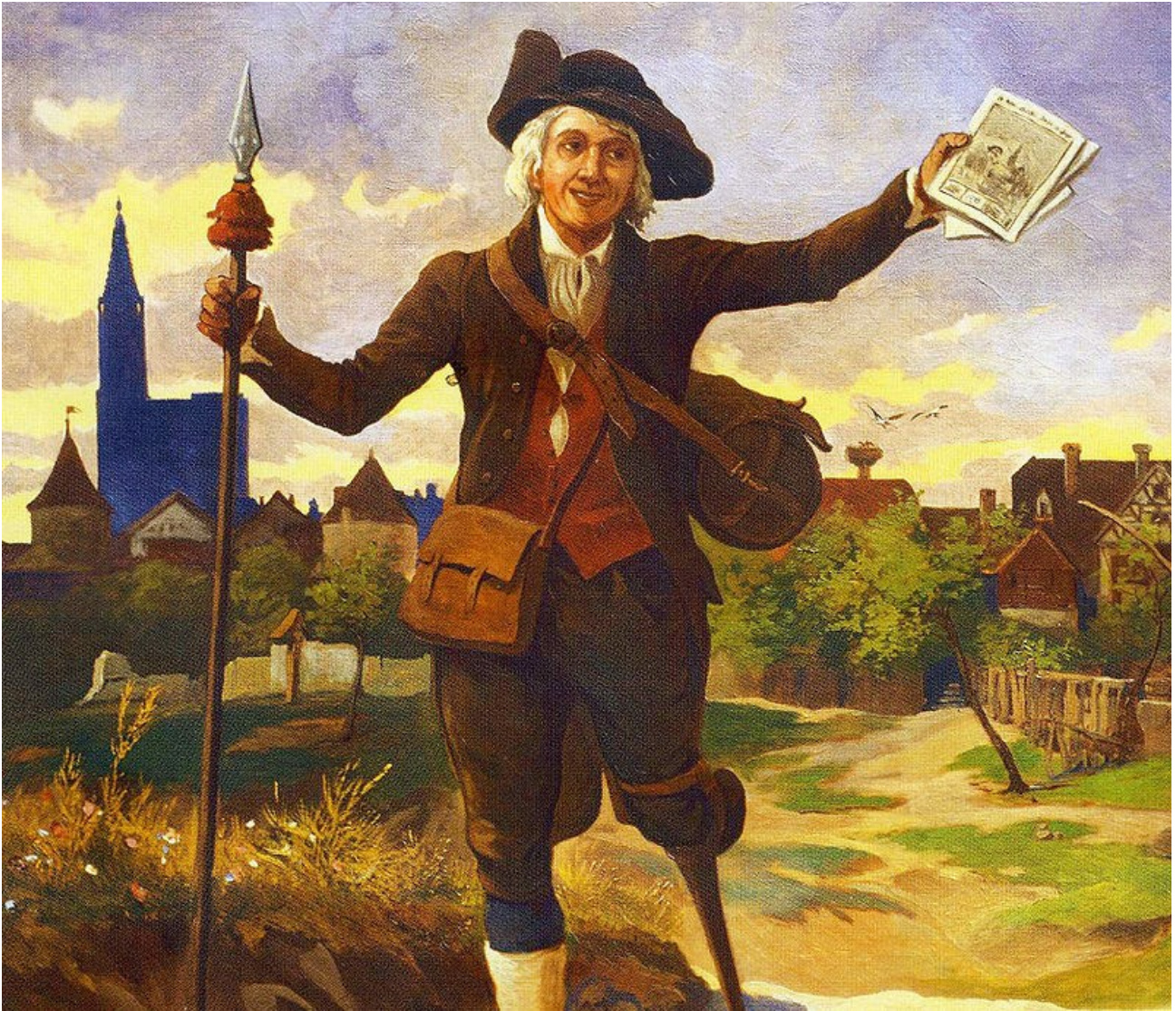
Couverture de l'Almanach Le Grand Messager boîteux par Tanconville en 1926