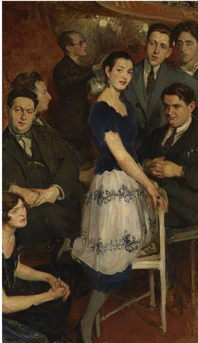
Le Groupe des Six – Germaine Tailleferre en bas à gauche. Peinture de Jacques-Émile Blanche

Dès lors, elle commence à donner des leçons pour vivre.