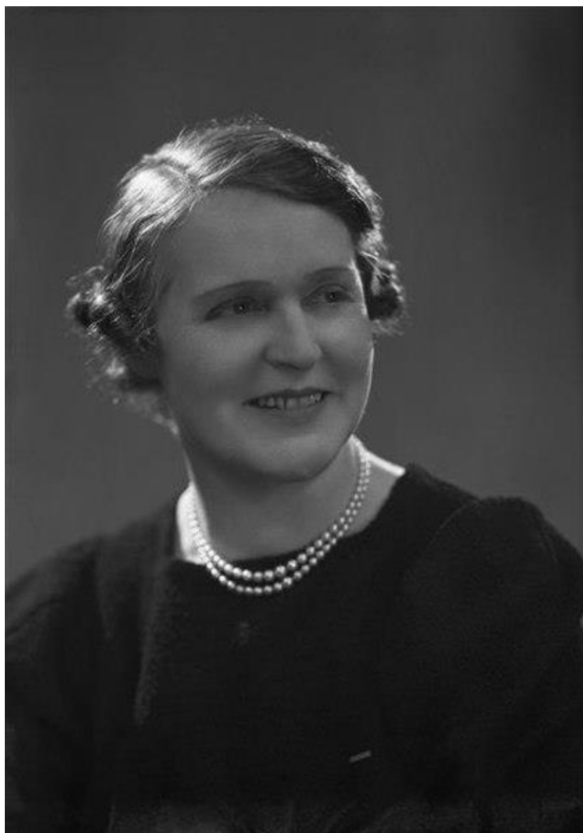
Germaine Tailleferre en 1937

Selon acte n°2670 – Archives de Paris en ligne – 13D 510 – vue 8/31