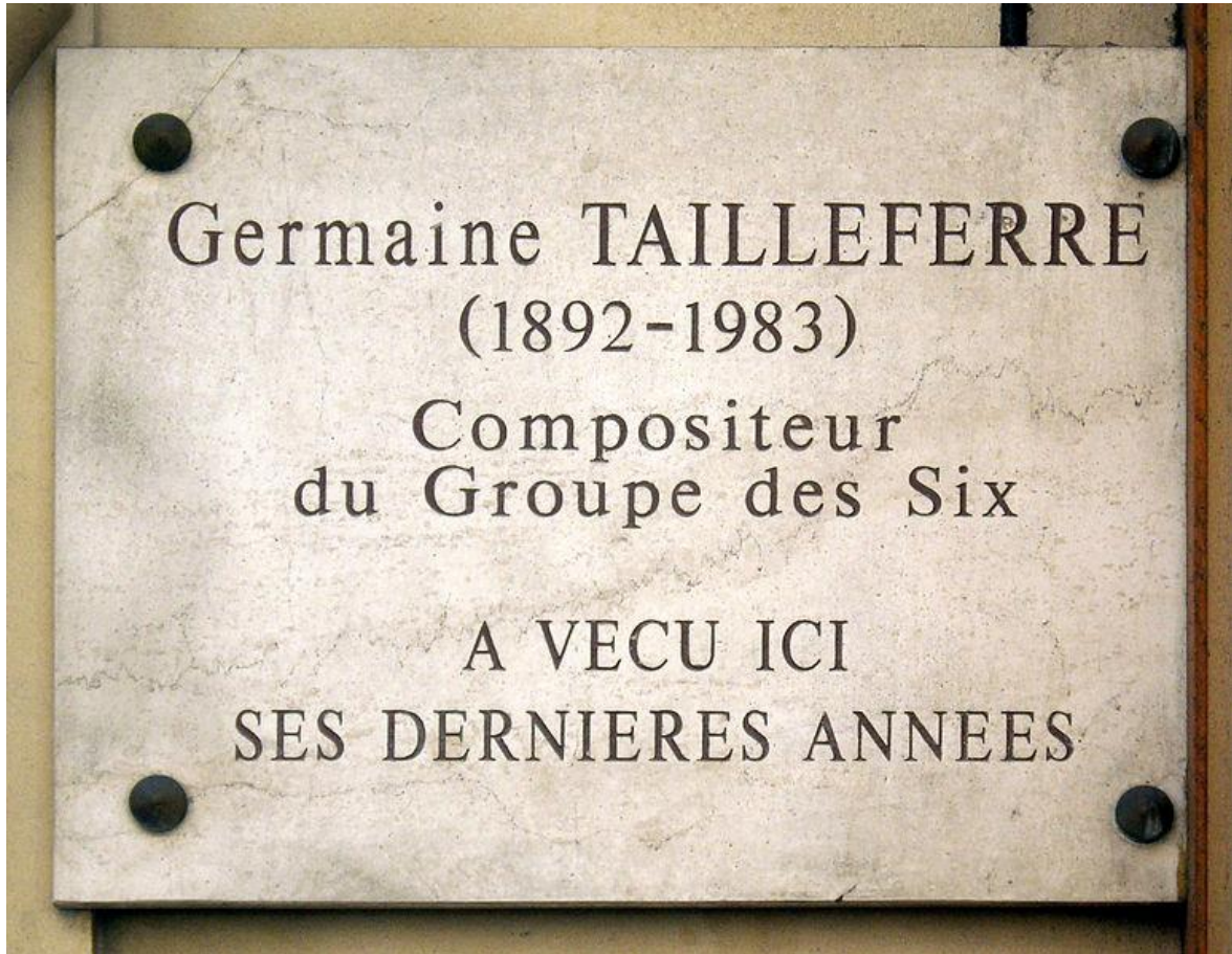
Plaque apposée au n° 87 de la rue d'Assas, Paris 6°