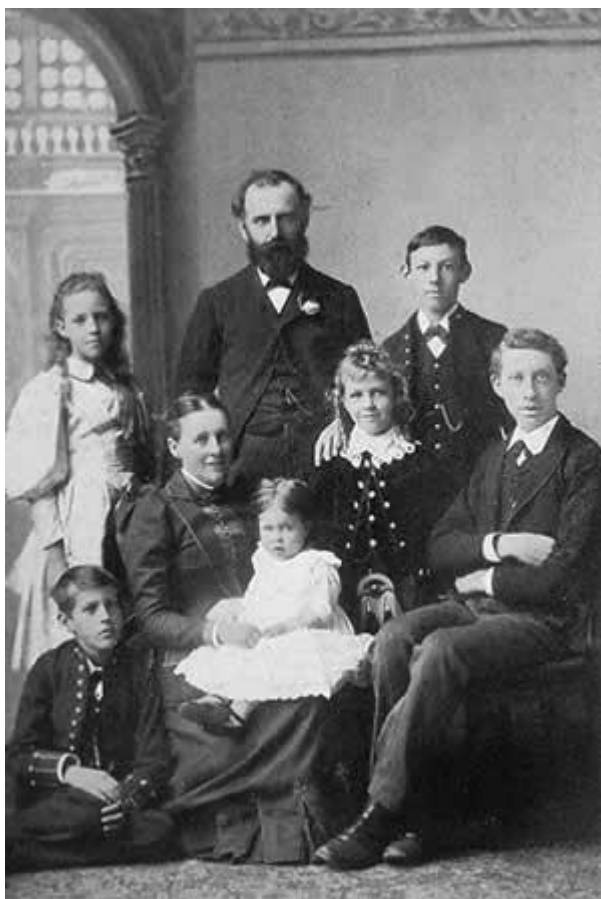
W.T. Stead avec son épouse et leurs six enfants. Années 1900.