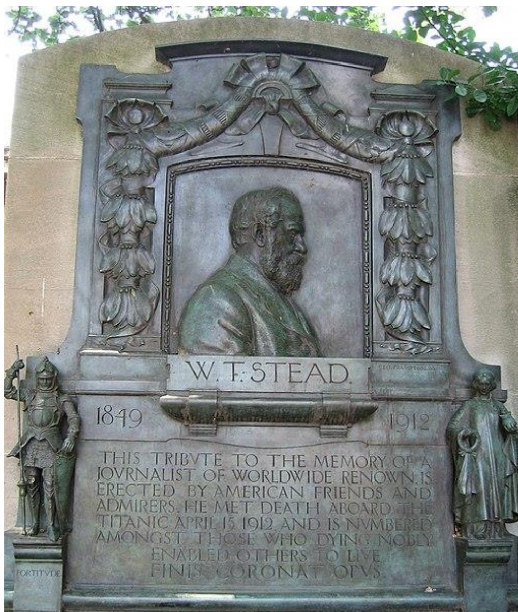
Mémorial W.T. Stead à Central Park à New York

Améliorer la condition ouvrière est un de ses leitmotivs et, dans un contexte d'agitation sociale qui monte en 1887, il dénonce les atteintes gouvernementales aux libertés.