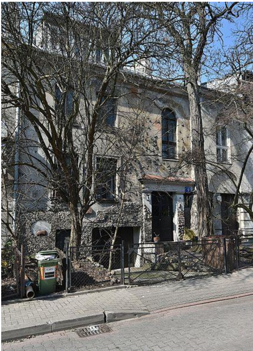
Façade de la maison, 9 rue Lekarska à Varsovie, où étaient cachées les bouteilles contenant la liste des enfants secourus.

« De toutes les expériences dramatiques que j'ai vécues pendant la guerre — mon séjour et les sévices que j'ai subis à la prison de Pawiak, les tortures de la Gestapo avenue Szucha, les jeunes que j'ai vus mourir à l'hôpital de l'Armée de l'intérieur où je travaillais comme infirmière pendant le soulèvement de Varsovie —, aucune ne m'a autant marquée que de voir Korczak (médecin-pédiatre) et les enfants (de son orphelinat ) marcher vers leur mort. ».