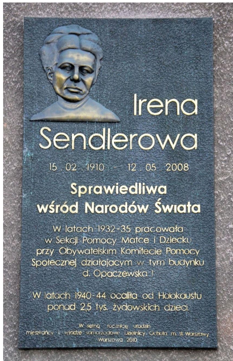
Plaque en hommage à Irena Sendlerowa apposée 2 rue Pawińskiego à Varsovie.

(Extrait de la lettre écrite par Irena et lue par une survivante Elzbieta Ficowska sauvée par elle en 1942 alors qu'elle était bébé.)