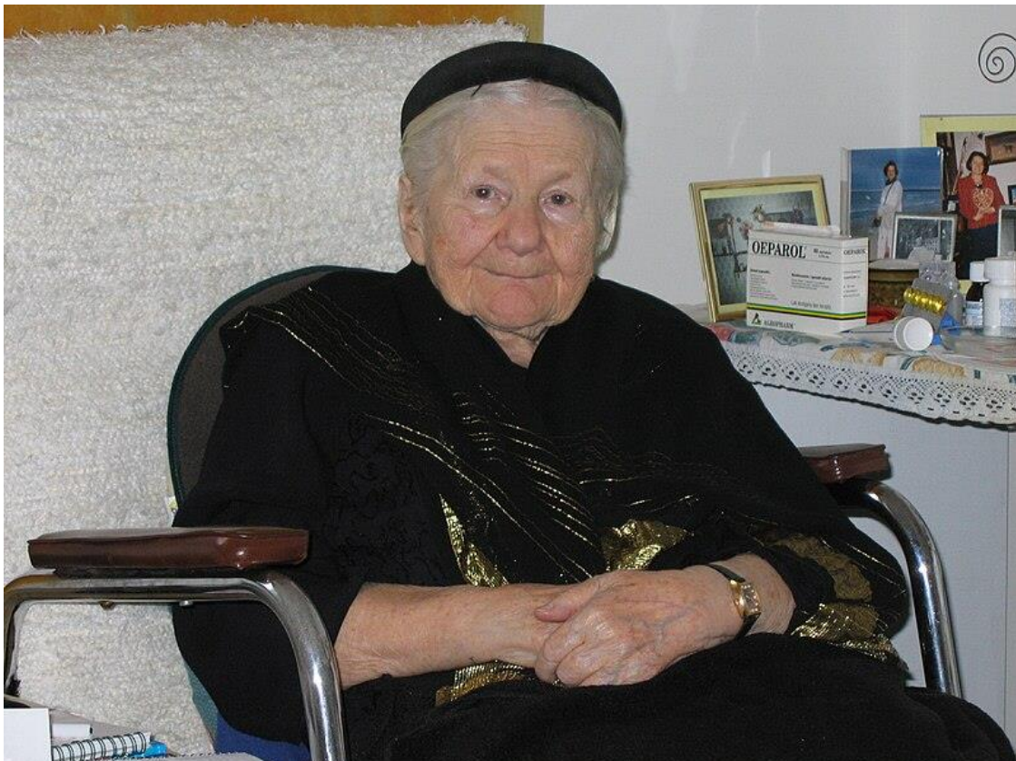
Irena Sendlerowa à Varsovie en 2005.

Ruinées, Irena et sa mère déménagent près de Łódź où vivent les grands-parents maternels. Devenue lycéenne, Irena s'active dans le scoutisme.