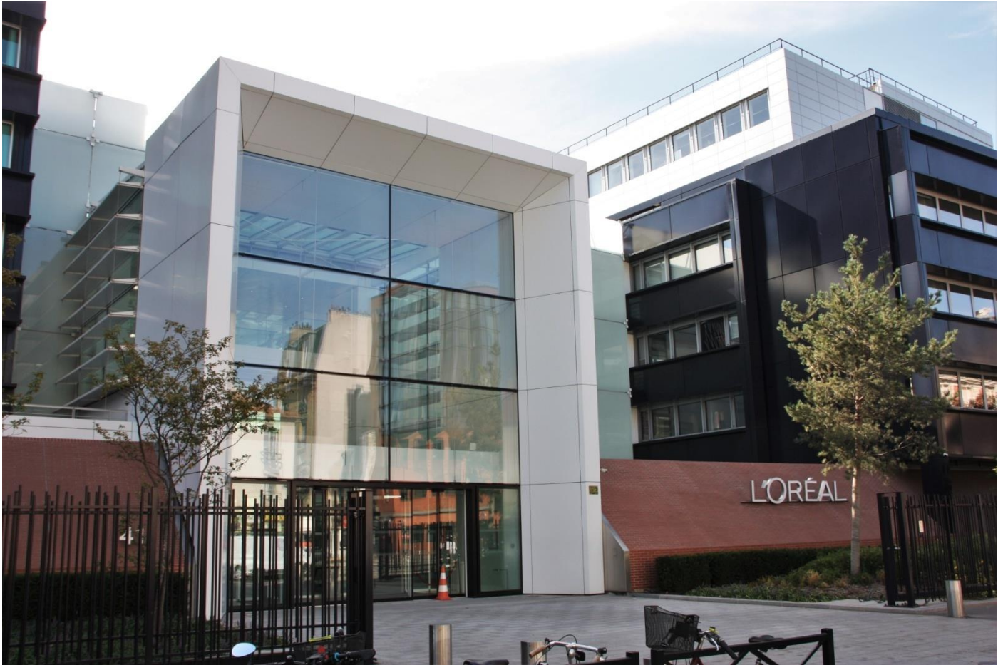
Siège mondial de L'Oréal à Clichy – Wikipedia

De retour aux manettes de sa société qui a prospéré entretemps, il invente la 1 ère teinture rapide puis le shampooing Dopal.