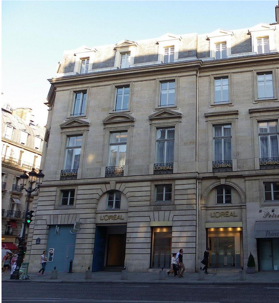
Siège social de L'Oréal au 14 rue Royale à Paris (Classé). Wikipedia

Après la Libération, ces engagements en faveur de l'ennemi, lui valent d'être interdit d'exercer toute action dirigeante. Mais, défendu par quelques Résistants dont André Bettencourt – son futur gendre- il échappe à toute sanction.