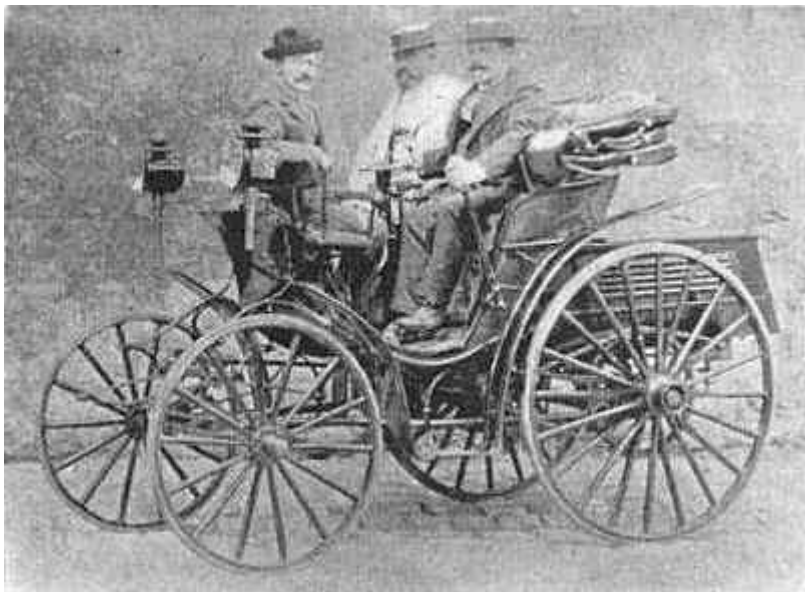
Roger-Benz Victoria 1895