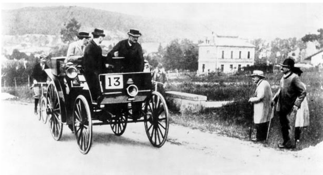
Roger-Benz Phaéton juin 1895

Devenu partenaire commercial performant de Carl Benz , l'ingénieur-designer Émile Roger permet à ce constructeur allemand de lancer véritablement une production en série et de développer le marché international de ses voitures. Emile Roger présente à l'Exposition universelle de 1889 à Paris, (qui voit la naissance de la Tour Eiffel ) des moteurs et automobiles Benz .