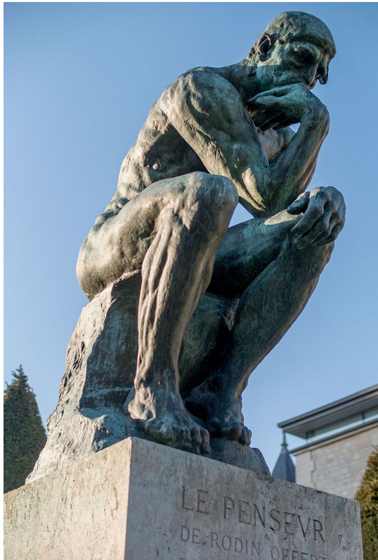
Le Penseur de Rodin 1881-1882