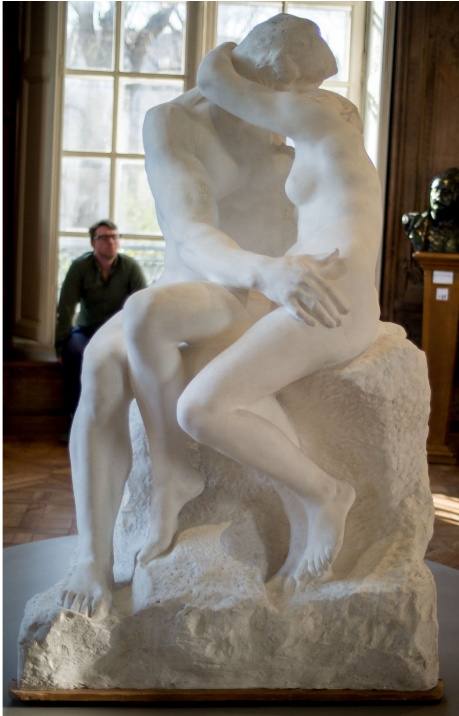
Le Baiser 1898 – Musée Rodin Paris