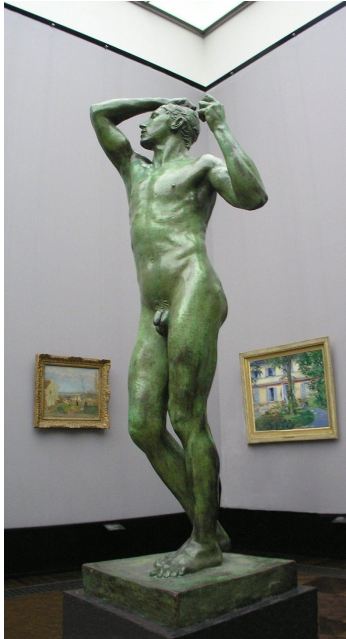
L'âge d'airain – Salon 1877

Un séjour à Rome et à Florence lui révèle Donatello et Michel-Ange qui seront pour lui sources d'inspiration.