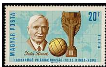
Timbre de 1966 à l'effigie de Rimet.