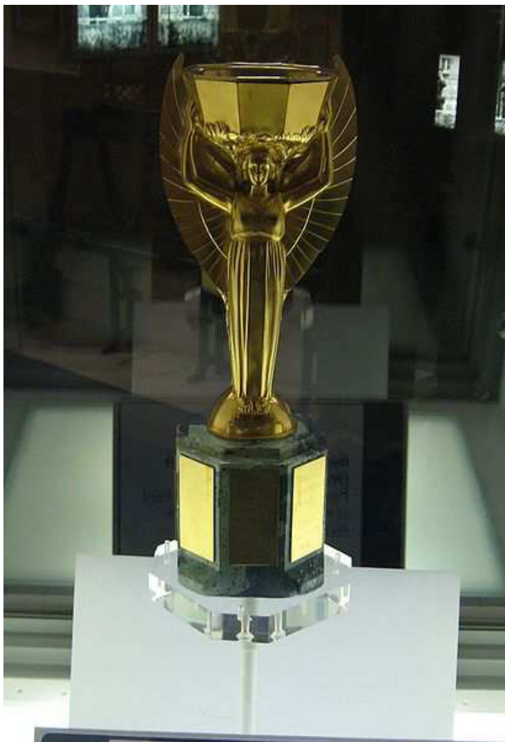
Trophée Jules Rimet

Rimet pousse à l'organisation d'un tournoi de football aux Jeux olympiques de 1908, réservé aux joueurs amateurs, tout en défendant l'avènement du professionnalisme, indispensable si l'on veut ouvrir le football à toutes les couches de la population.