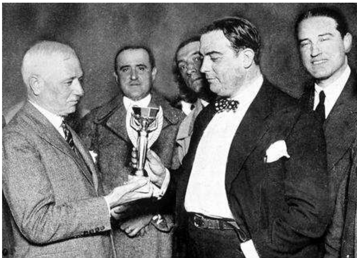
Jules Rimet remet le trophée de la 1 ère coupe du monde au président de la fédération uruguayenne en juillet 1930

Jules Rimet emporte dans sa valise le trophée de la compétition. Comme la traversée transatlantique dure un mois, les footballeurs européens, en mal de préparation, en profitent pour s'entraîner sur le pont du paquebot, à la grande curiosité des passagers !