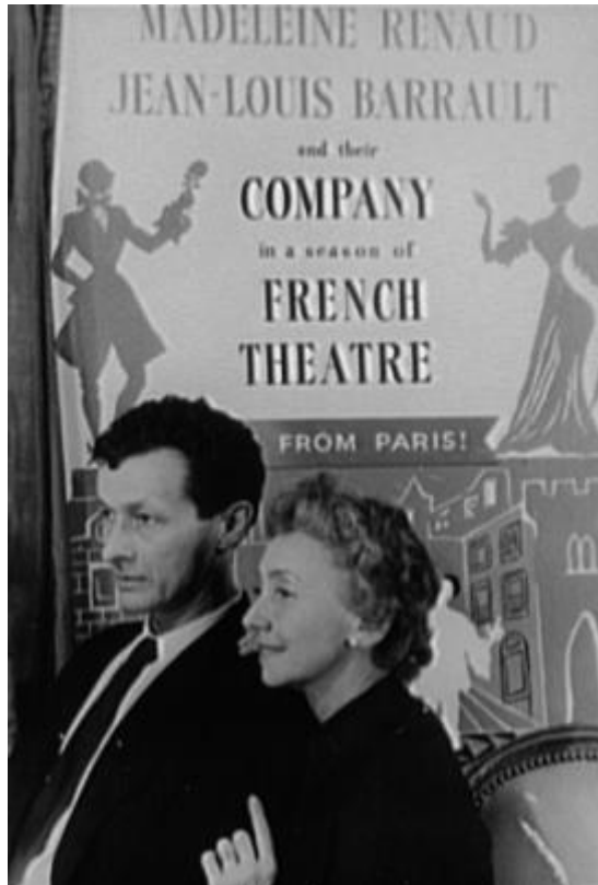
Madeleine-Renaud et Jean-Louis Barrault