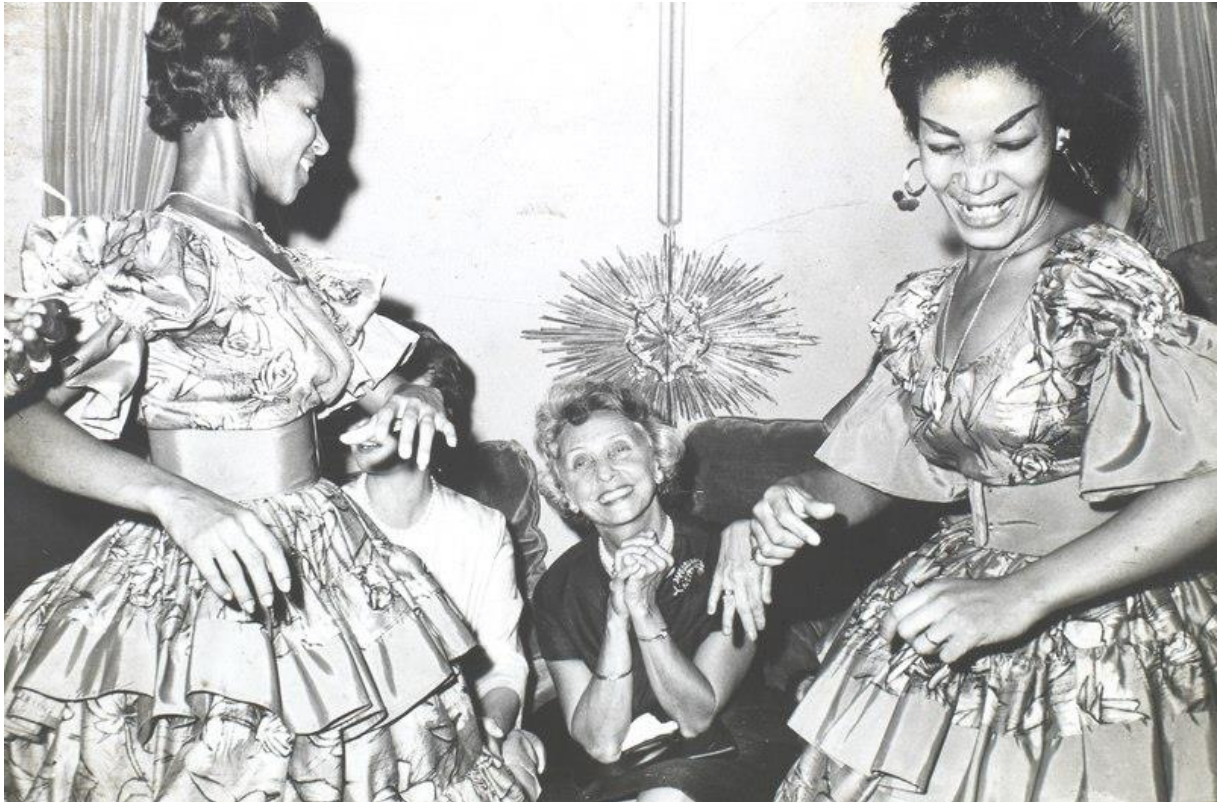
Madeleine Renaud en visite au Brésil en 1961

Madeleine Renaud meurt sept mois après son époux Jean-Louis Barrault.