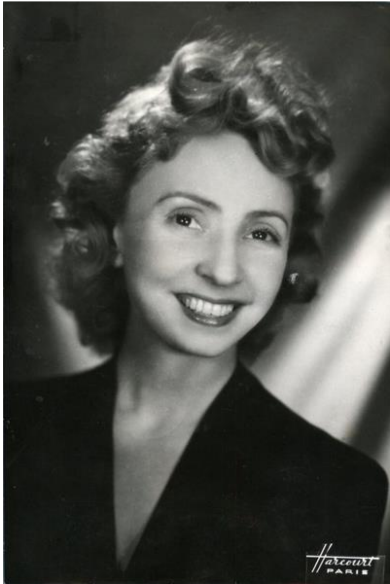
Madeleine Renaud vers 1945

Décédée le 23 septembre 1994 à Neuilly-sur-Seine 92 Hauts-de-Seine