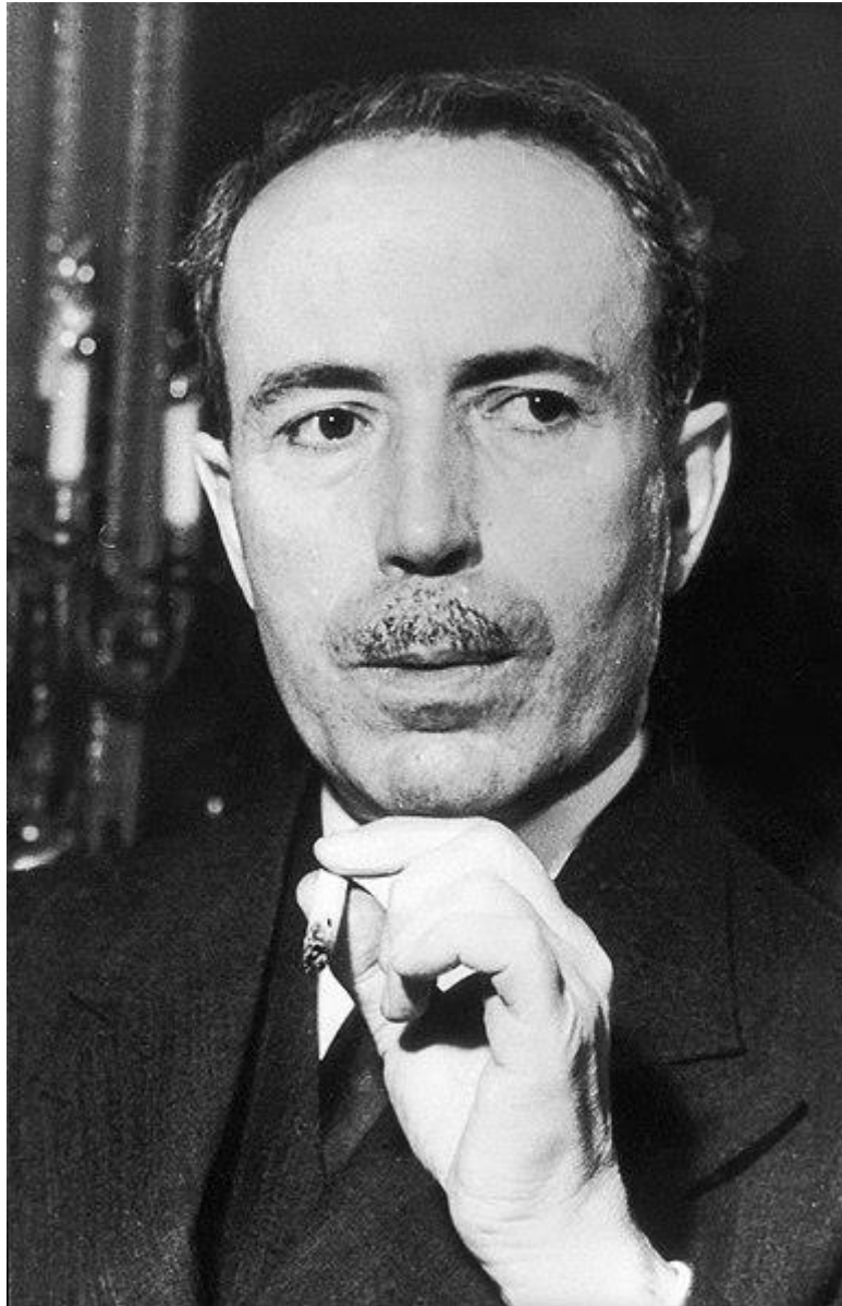
Antoine Pinay en 1952

Décédé le 13 décembre 1994 à l'âge de 102 ans à Saint-Chamond Loire 42