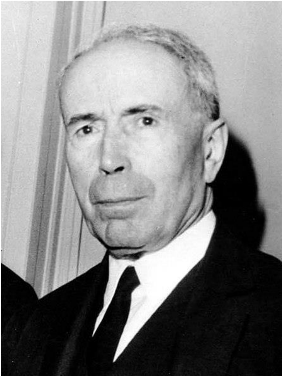
Antoine Pinay en 1969

Je me suis retrouvé seul à la tête de cette entreprise familiale. Cette expérience qui a duré trente ans m'a passionné. Confiera-t-il plus tard.