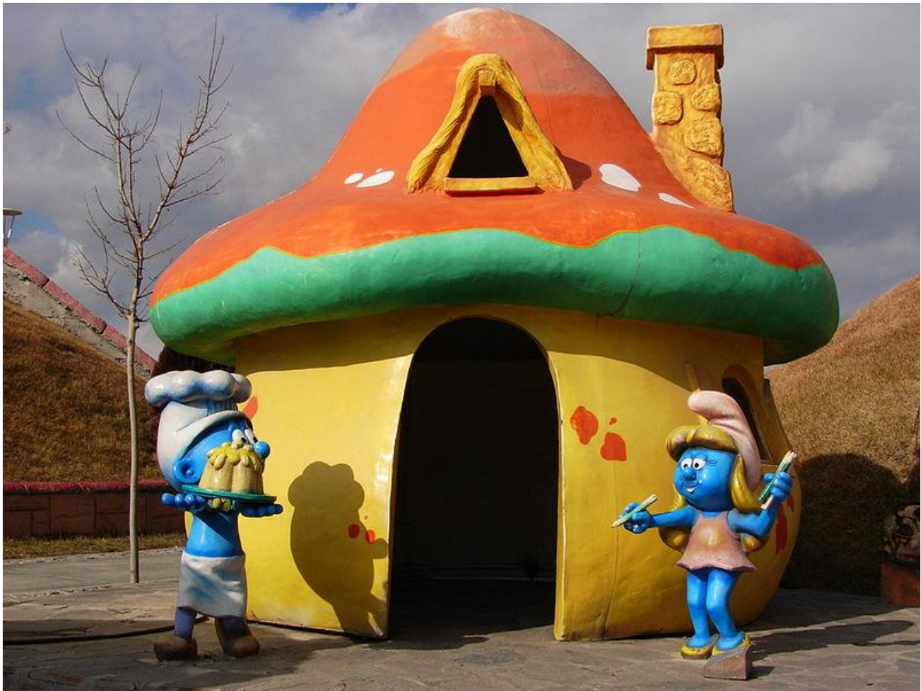
Maison à Schtroumpfs dans le parc d'attraction d'Ankara

Les lecteurs du journal Spirou en redemandent et les lutins bleus vont passer du petit récit, à l'album La flûte à six Schtroumpfs en 1958 et au court-métrage d'animation télé.