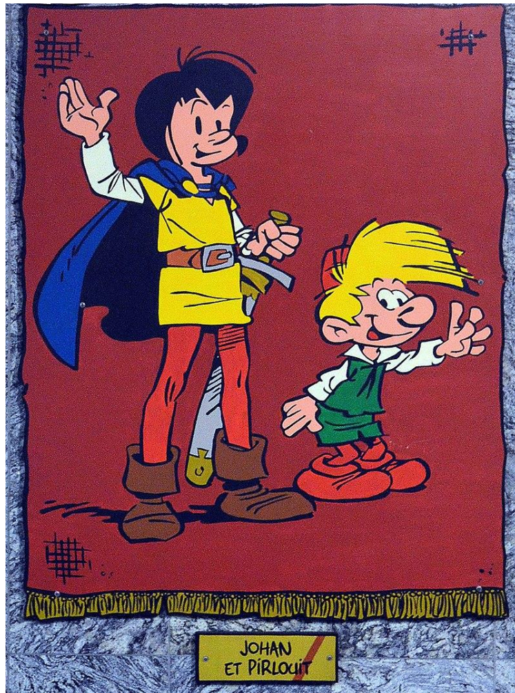
Station de métro Janson à Charleroi