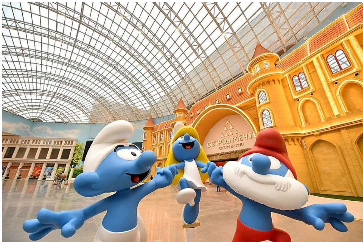
Un Schtroumpf, la Schtroumpfette, et le Grand Schtroumpf à Dream Island (Russie) – Wikipedia

L'album Le Schtroumpf financier sorti en novembre 1992 sera le dernier pour Peyo très fatigué qui décède d'une crise cardiaque juste avant de voir Noël 1992.