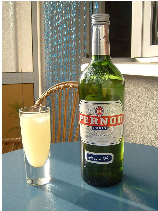
Pernod la plus ancienne marque d'anisés français.

Jules-Félix décède en juillet 1928 et quelques mois plus tard les concurrents homonymes de Pontarlier et d'Avignon fusionnent sous la marque Établissements Pernod .