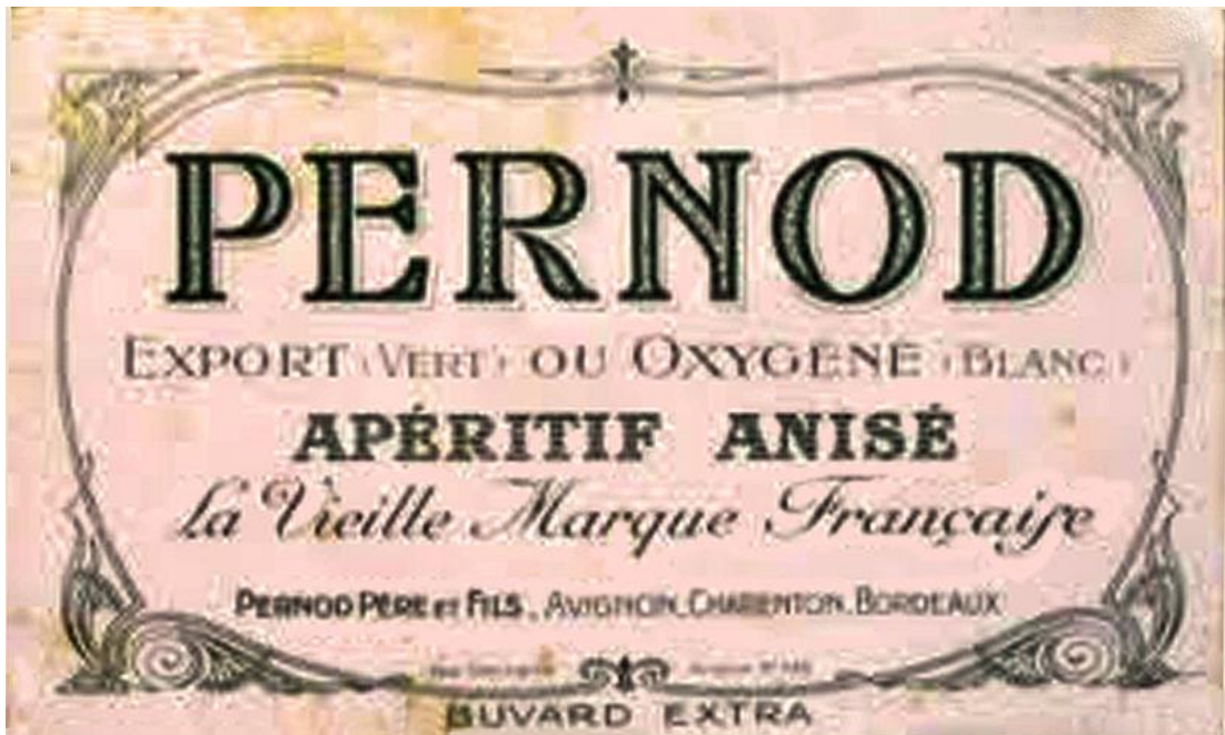
Buvard publicitaire Pernod Père et Fils