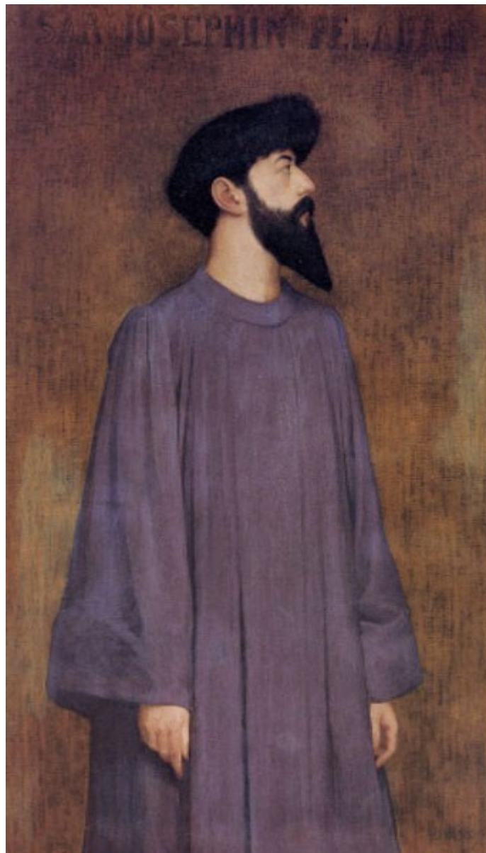
Portrait de Joséphin Peladan par Alexandre Séon (vers 1892), Musée des Beaux-arts de Lyon.

Décédé le 27 juin 1918 à Neuilly-sur-Seine Hauts-de-Seine 92