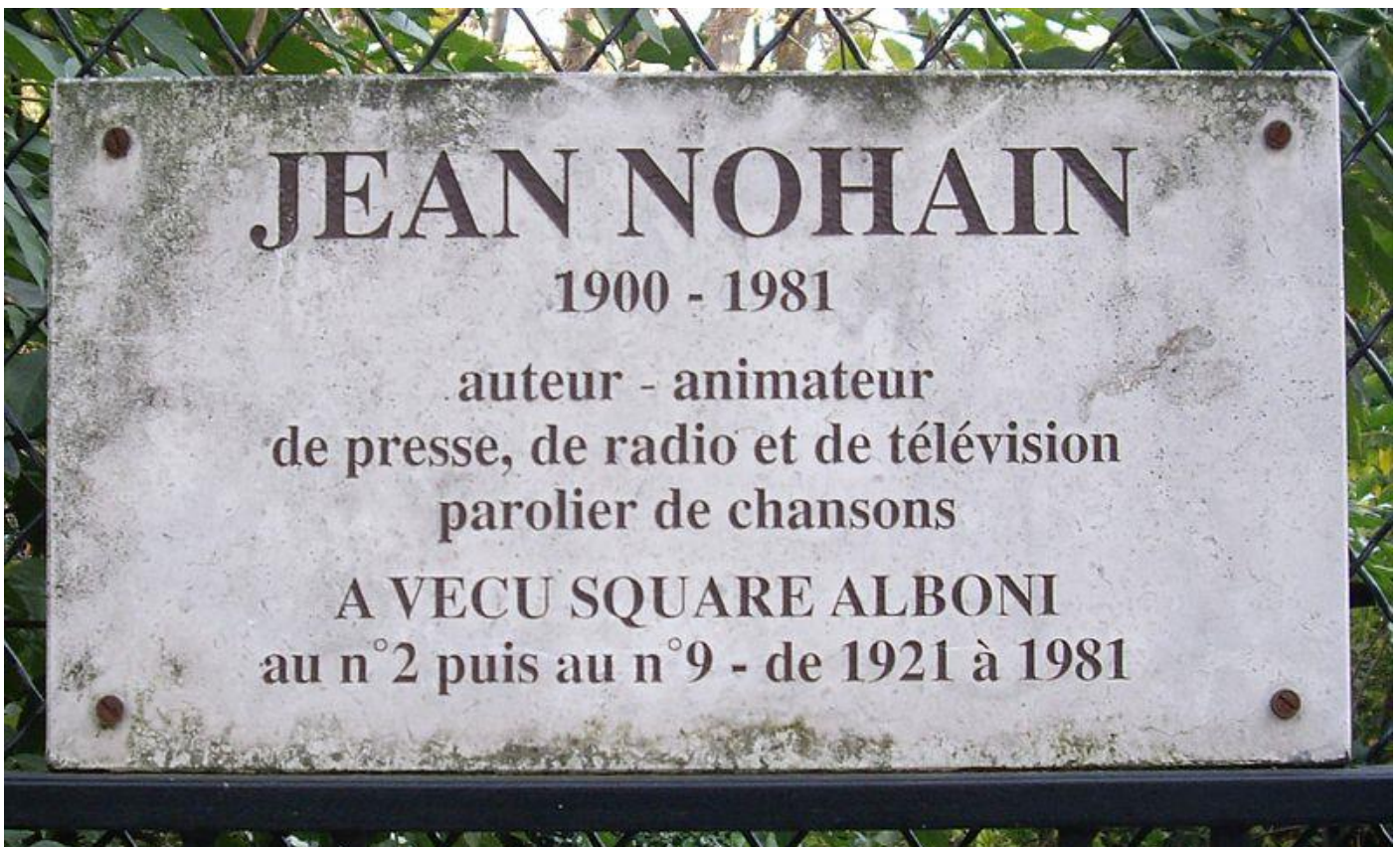
Plaque square Alboni

Le prix littéraire Jean Nohain est créé en 2004.