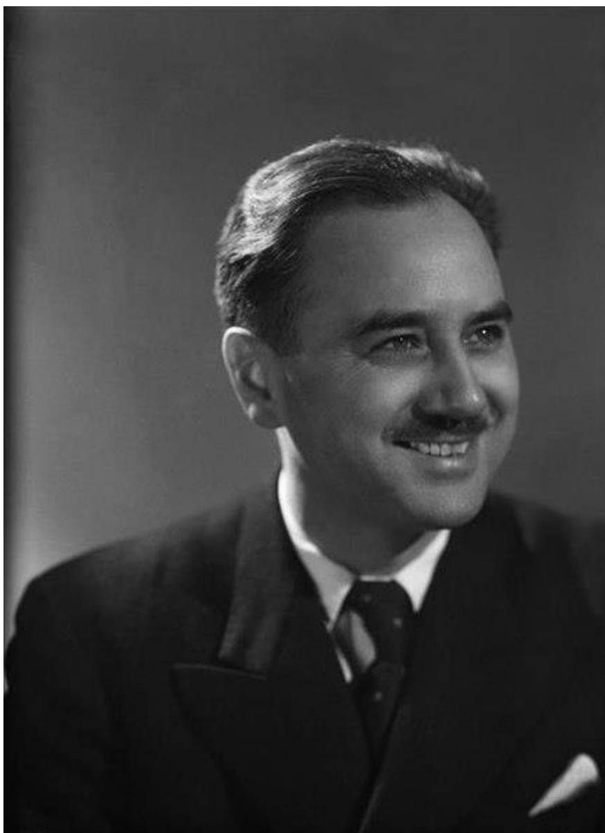
Jean Nohain – 1939