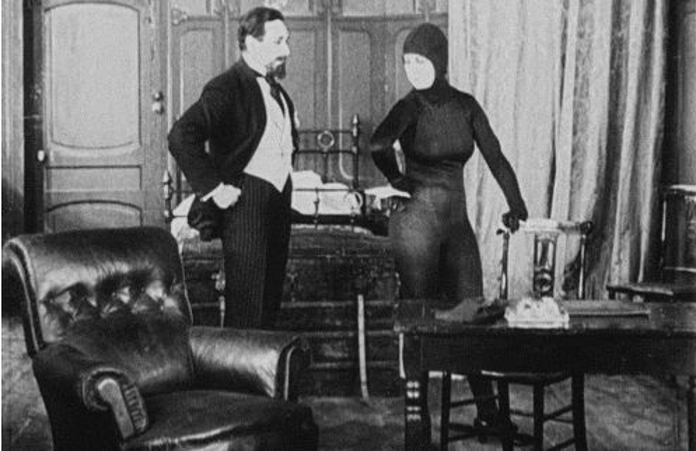
Musidora en Irma Vep dans Les Vampires en 1915