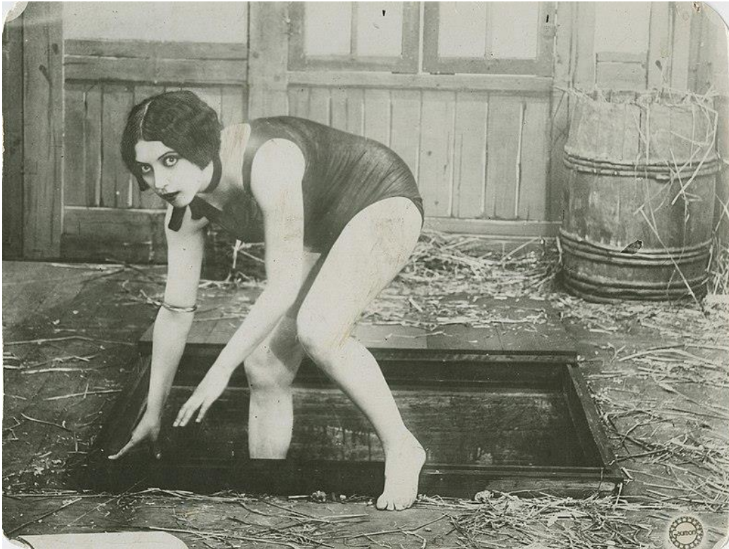
Musidora dans le film Judex en 1916

Venez vous passerez dans un sketch, venez vous direz des chansons ». Et comme je finissais de dire des chansons, un artiste russe m'offrait de jouer une pantomime. »