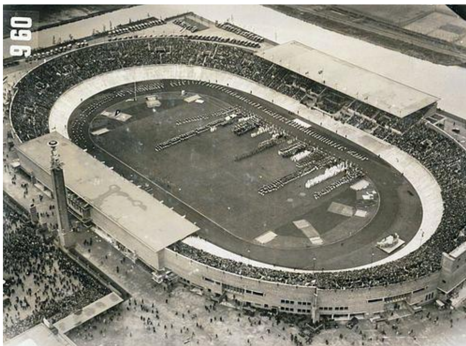
Stade olympique d’Amsterdam aux JO 1928.

Alice Milliat, qui pratiquera aussi natation et hockey, se consacre à l’aviron au sein du Femina Sport , 1 er club omnisports féminin dont elle devient présidente à partir de 1915.