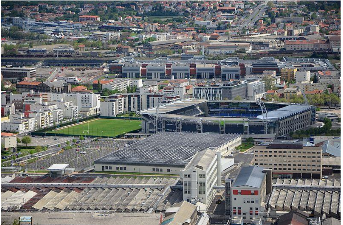
Stade Marcel Michelin à Clermont près de l'usine Michelin de Cataroux