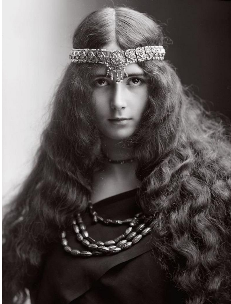
Cléo de Mérode par Nadar aux environs de 1905

Côté photographes, Nadar père et fils, Reutlinger, Ogerau , Benque... l'immortalisent dans des cartes postales façon images pieuses, qui feront le tour du monde.