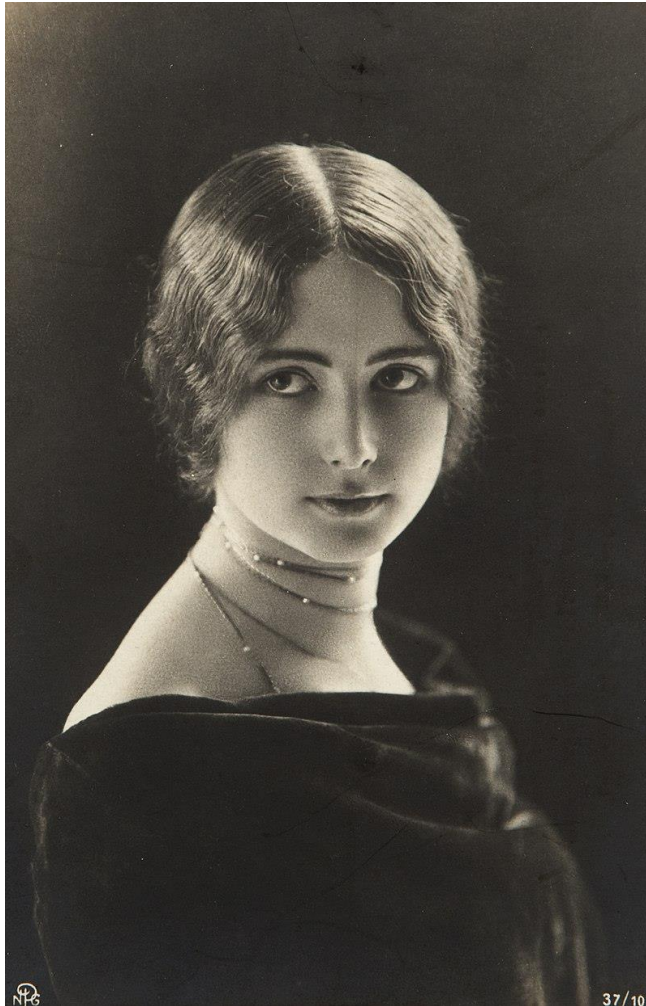
Cléo de Mérode vers 1903 – carte postale éditée par MPG.