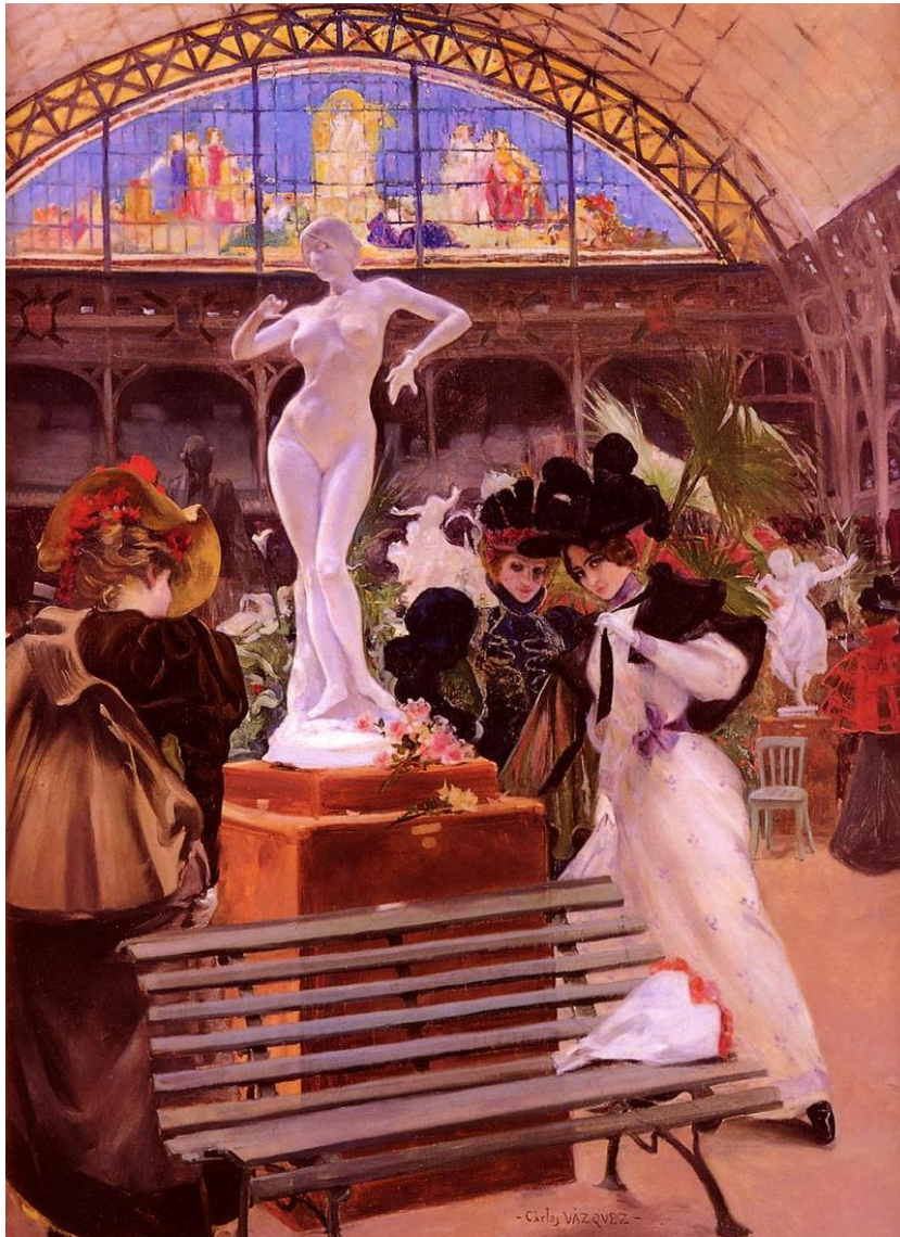
Cléo de Mérode représentée par la sculpture de Falguière – peinture de Carlos Vázquez Úbeda

Aussi dès l'âge de 7 ans, Cléo entre à l'école de danse de l'Opéra de Paris, mais à la différence des autres petits rats, ascendance noble et particule lui ouvrent la porte des salons mondains.