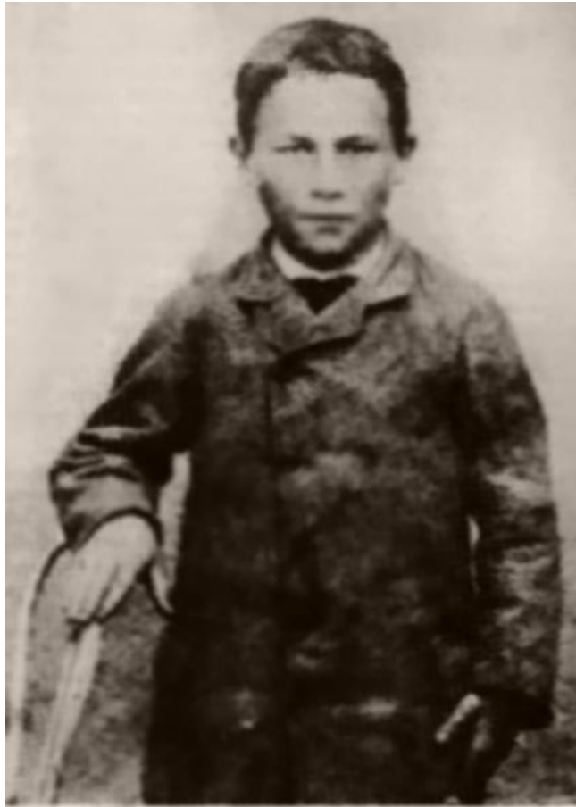
Joseph Meister vers 1885