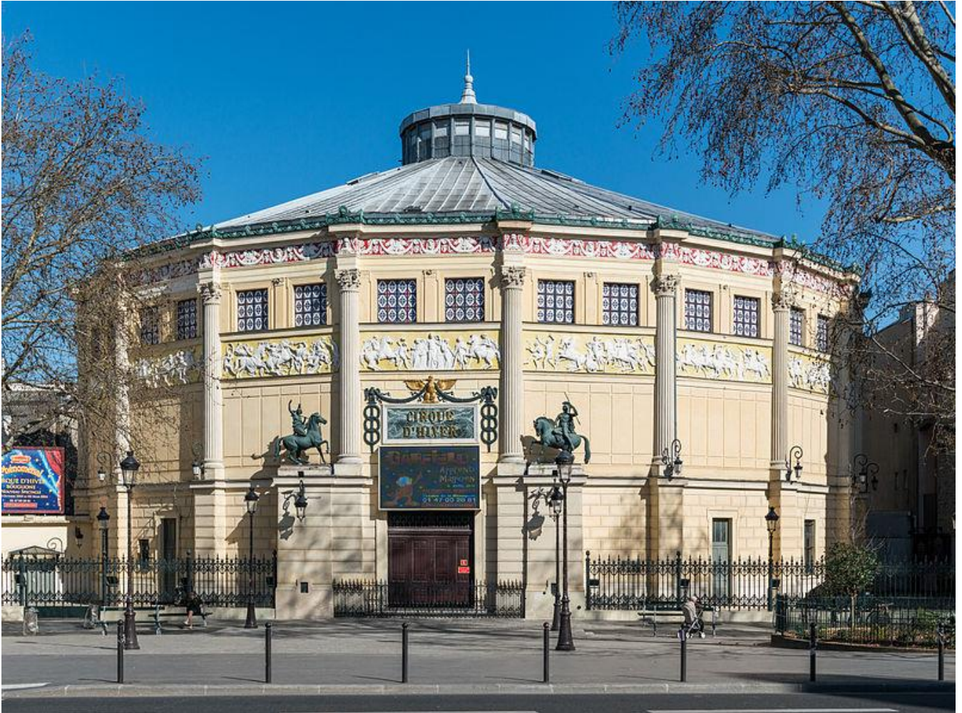
Le Cirque d'Hiver Paris 11e

C'est à 44 ans qu'il entame en 1949, une carrière de réalisateur pour la RTF, d'abord avec Music-Hall Parade , histoire de divertir les téléspectateurs en chanson.