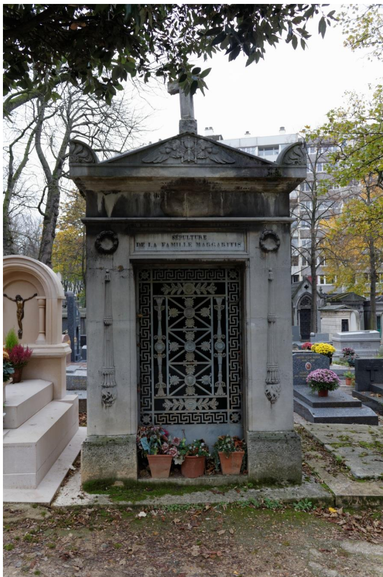
Sépulture de Gilles Margaritis au cimetière du Père-Lachaise