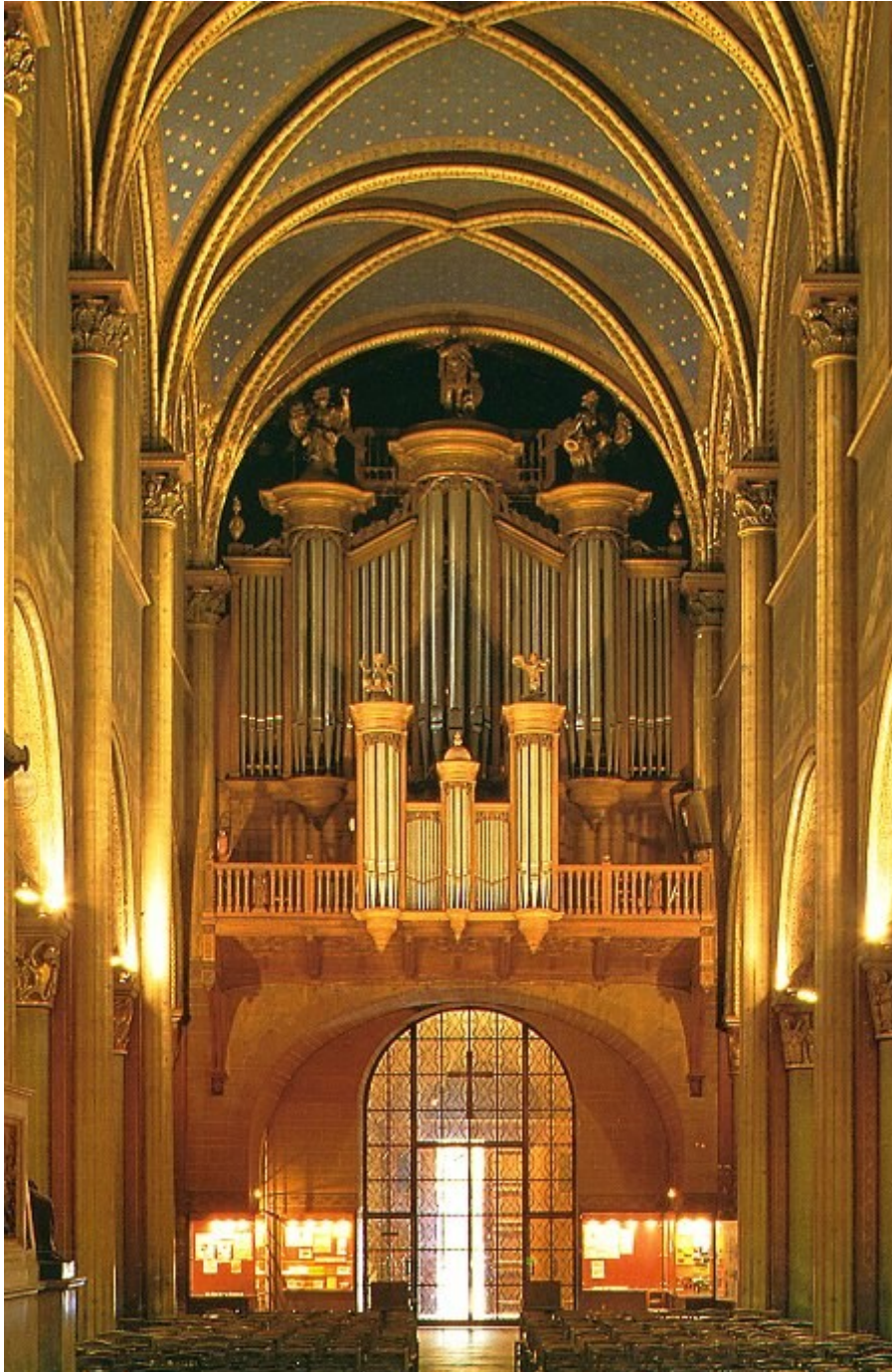
Orgue de St-Germain-des-Prés

Concertiste prisé dans le monde entier, sa notoriété s'accroît au point qu'en 1949, il se produit à 47 reprises.