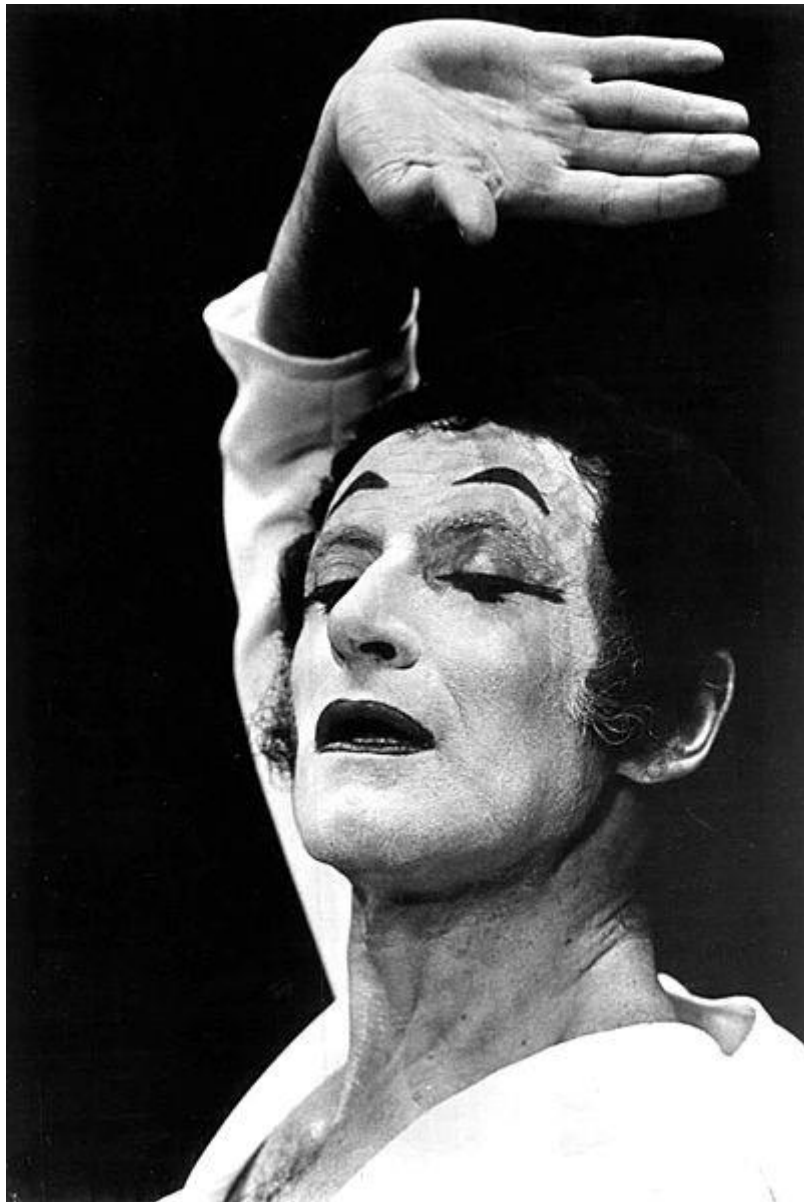
Le mime Marceau en 1971

Décédé le 22 septembre 2007 à Cahors 46 Lot