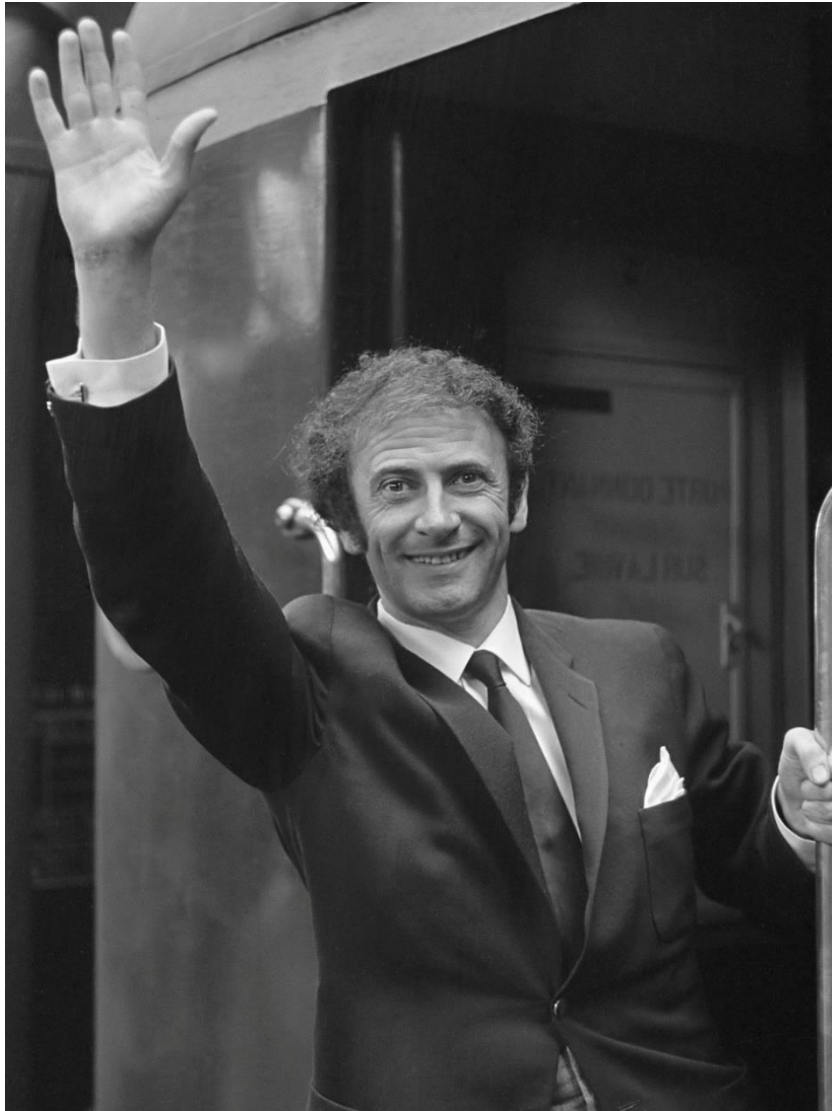
Marcel Marceau en 1962

En plus d'un demi-siècle de carrière, Marcel Marceau ne cesse de questionner l'art théâtral par le parti pris du silence. Un silence qui porte ses dialogues « écrits » par le corps et « entendus » par le regard de tout humain par-delà les frontières.