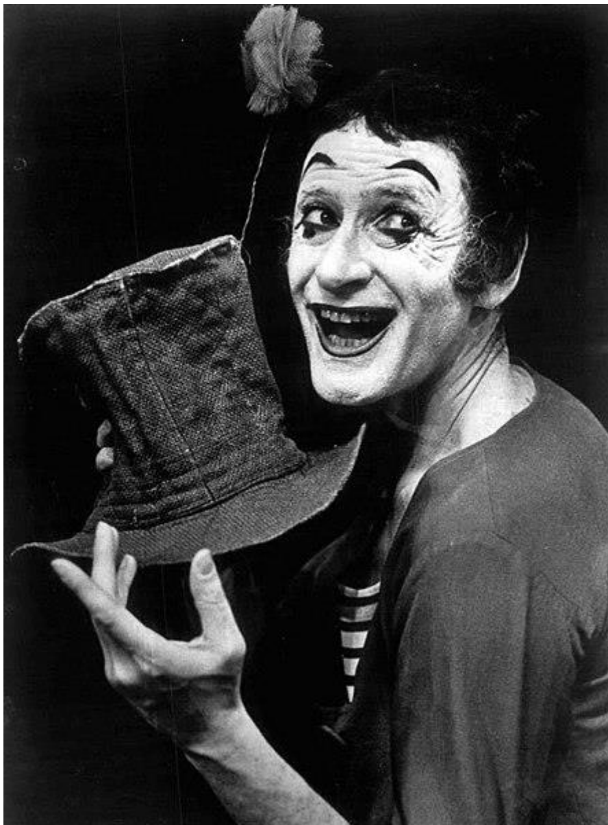
Bip le clown en 1974

« Bip est un personnage intemporel, tout en étant proche de mes rêves d'enfants. Il se cogne à la vie qui est à la fois un grand cirque et un grand mystère, et j'aime à dire qu'il finit toujours vaincu, mais toujours vainqueur... Il est tout ensemble l'homme de la rue, un vagabond du quotidien et l'homme universel affrontant le tragi-comique de l'existence... Il est l'homme tout simplement, se montrant dans la nudité et la fragilité de son être. »