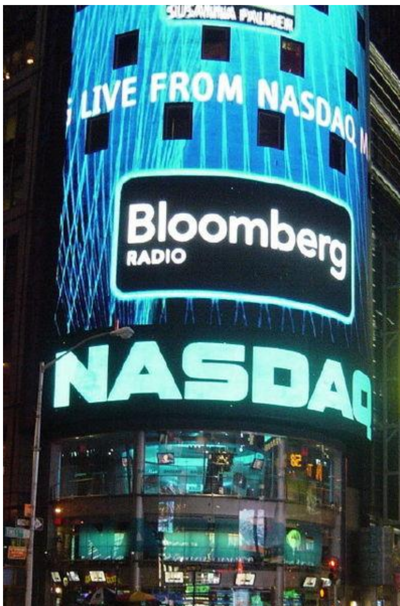
NASDAQ in Times Square, New York City, USA.

Dès 22 ans, devenu surveillant de baignade il quitte les bords de piscine de Long Island, pour nager en maître dans la grande finance. Avec 5.000 dollars, il fonde en 1960 sa propre société d'investissement.