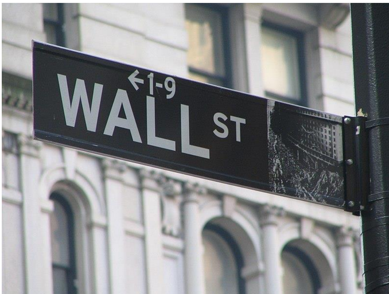
Panneau indiquant Wall Street

Il préside même pendant 2 ans ce marché basé sur le traitement automatique des transactions qui deviendra l'un des plus importants des États-Unis.