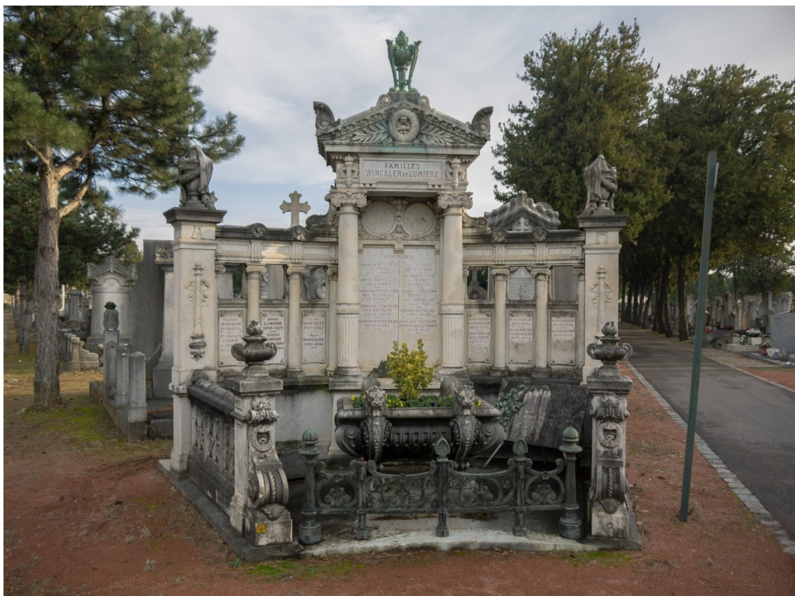
Tombe des frères Lumière au cimetière de La Guillotière, à Lyon Rose Lumière y est inhumée