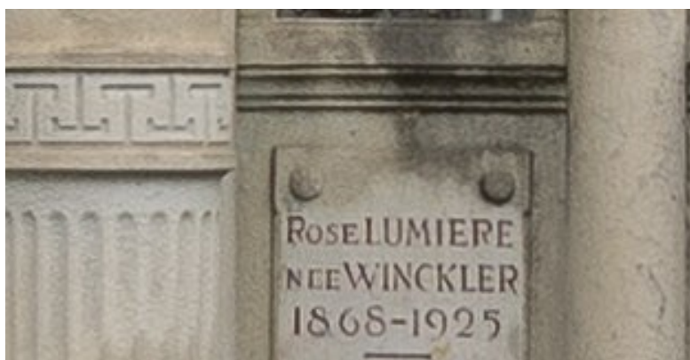
Inscription sur la tombe des Frères Lumière à Lyon