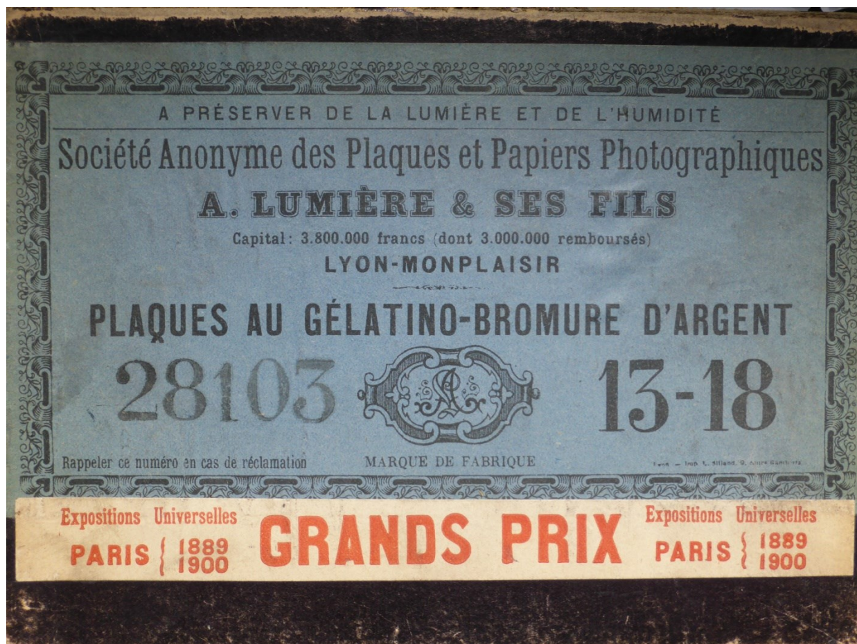
Boîtes de plaques photographiques Lumière « À préserver de la lumière » !...

Auguste et Louis Lumière frères inséparables, font construire une villa jumelle à côté de l'entreprise.