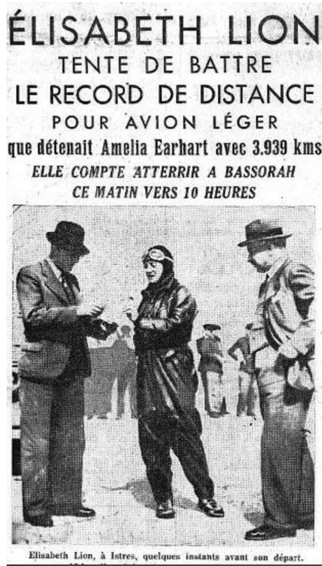
Le Figaro 14 mai 1938

Sous son grand calme et sa réserve, se déchaîne une passion qui transforme sa vie en destin.