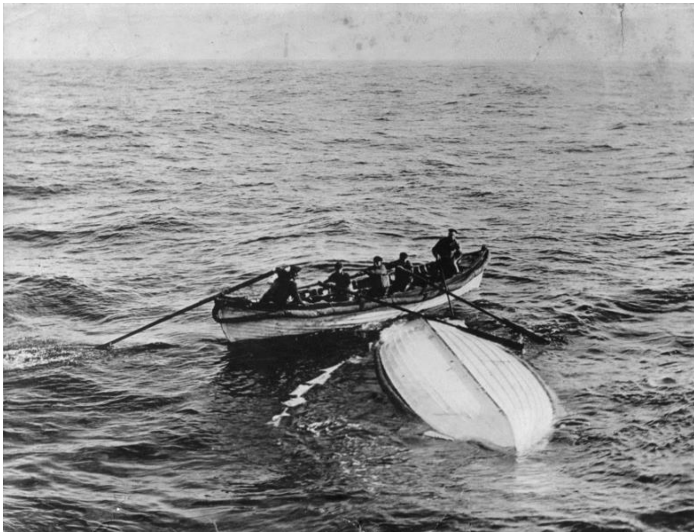
Lightoller a survécu à bord du canot pliable B qui flottait retourné et qui a été retrouvé par les marins du Mackay-Bennett navire affrété par la White Star Line pour repêcher les dépouilles des victimes du Titanic .

Après la Seconde Guerre mondiale, il gère un petit chantier naval, Richmond Slipways à Londres qui construit et répare des vedettes pour la police fluviale.