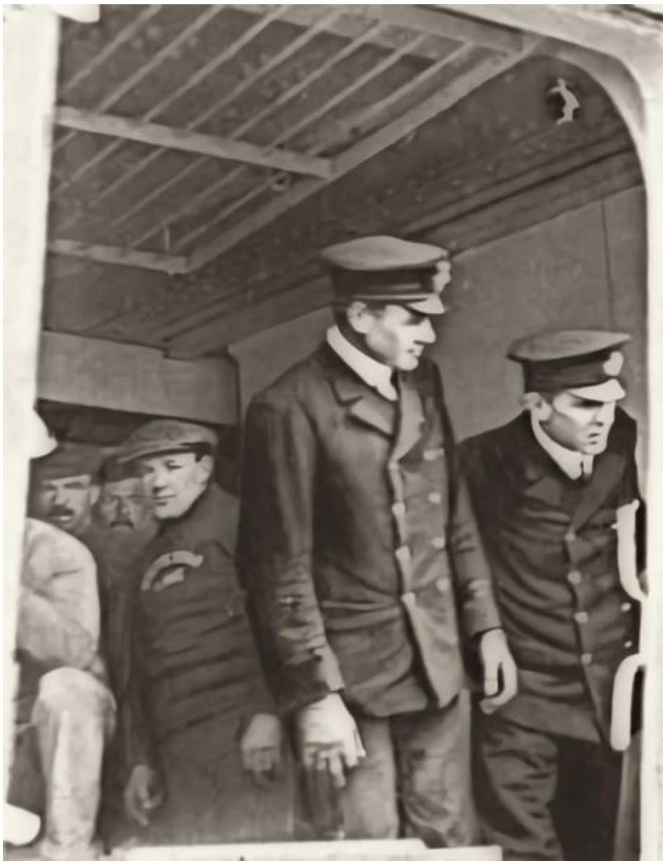
Lightoller sur le Titanic en compagnie du 1 er officier Murdoch le 11 avril 1912

Peu après, il quitte la White Star Line devant le peu d'opportunités d'avancement.