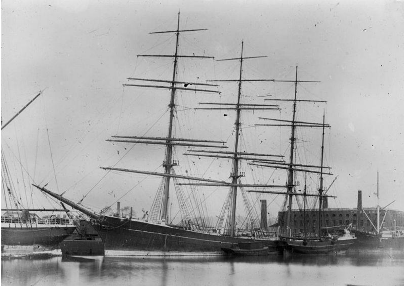
Primerose Hill, voilier quatre mâts où Lightoller fait son apprentissage

Outre les dangers de la mer, il faut crapahuter dans les mâts sans craindre le vertige, découvrir les joies du mal de mer, lutter contre les inévitables rats et cafards sans compter les maladies et la faim, au point que l'occupation favorite consiste à chaparder de la nourriture pour améliorer l'ordinaire.