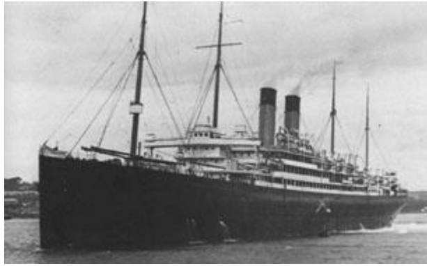
La dernière affectation de Lightoller au sein de la White Star est le Celtic.