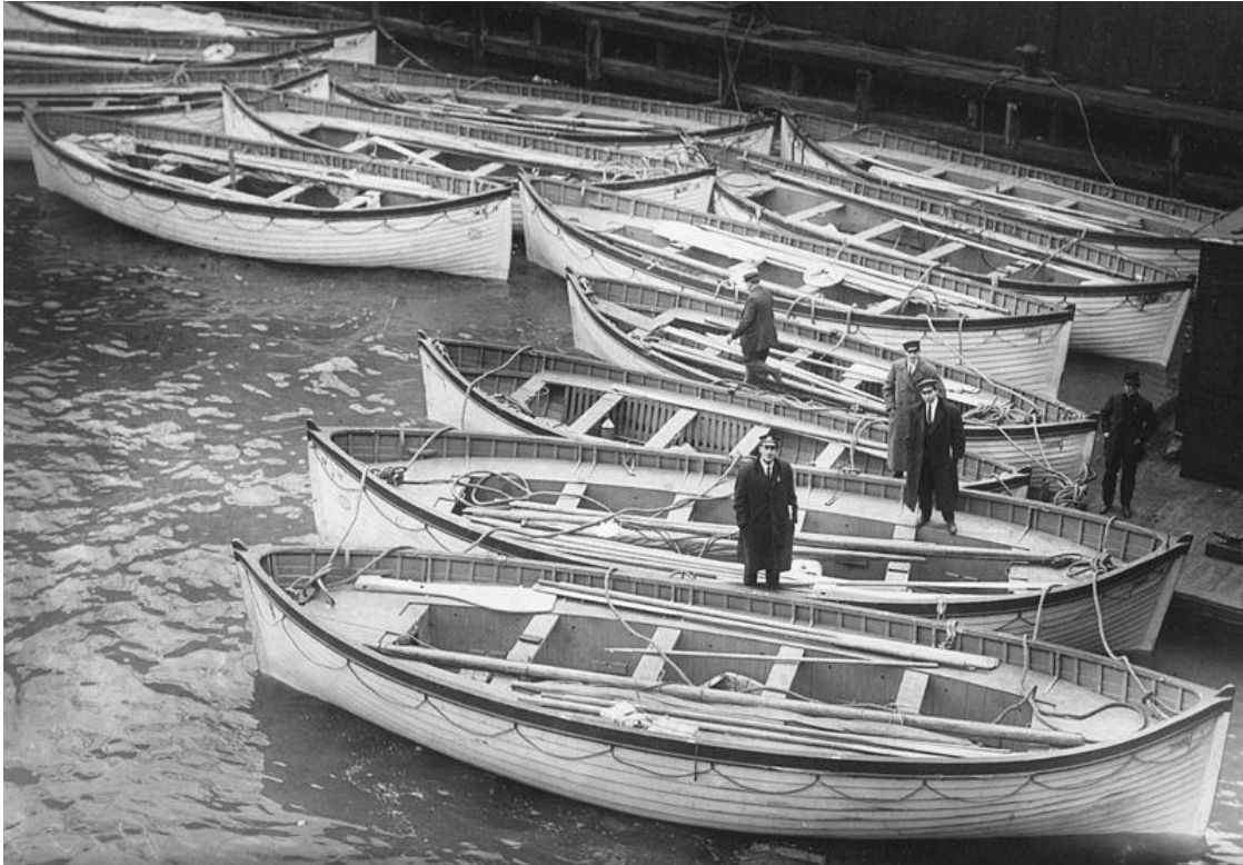
Canots de sauvetage du Titanic – récupérés à New-York