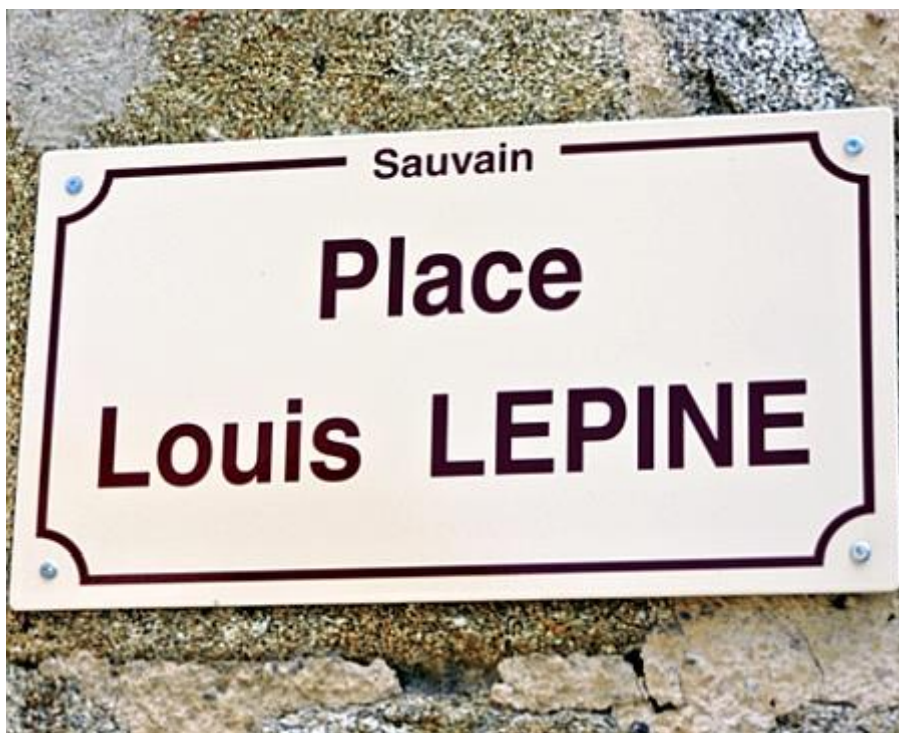
Plaque qui honore la mémoire de l'illustre Louis Lépine à Sauvain (Loire) près du Musée de la Fourme et des Traditions et du château hérité de son épouse Montbrisonnaise

(*) Ce règlement pour la région parisienne et riche de 35 articles, limite notamment la vitesse à 20 km/h en rase campagne et à 12 km/h en agglomération. Sa portée est considérable puisqu'il sert d'exemple pour généraliser, le premier code de la route applicable à tous les départements par décret du 10 mars 1899.