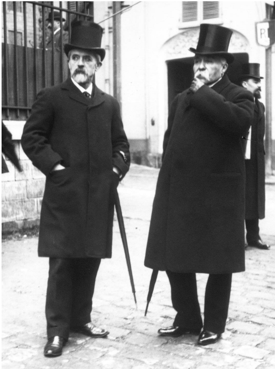
Louis Lépine (à gauche) et Georges Clémenceau en 1908

Ce village ligérien « de caractère » à l'image de son illustre habitant, lui rend hommage par une place à son nom au cœur du bourg et près du Musée de la Fourme et des Traditions .