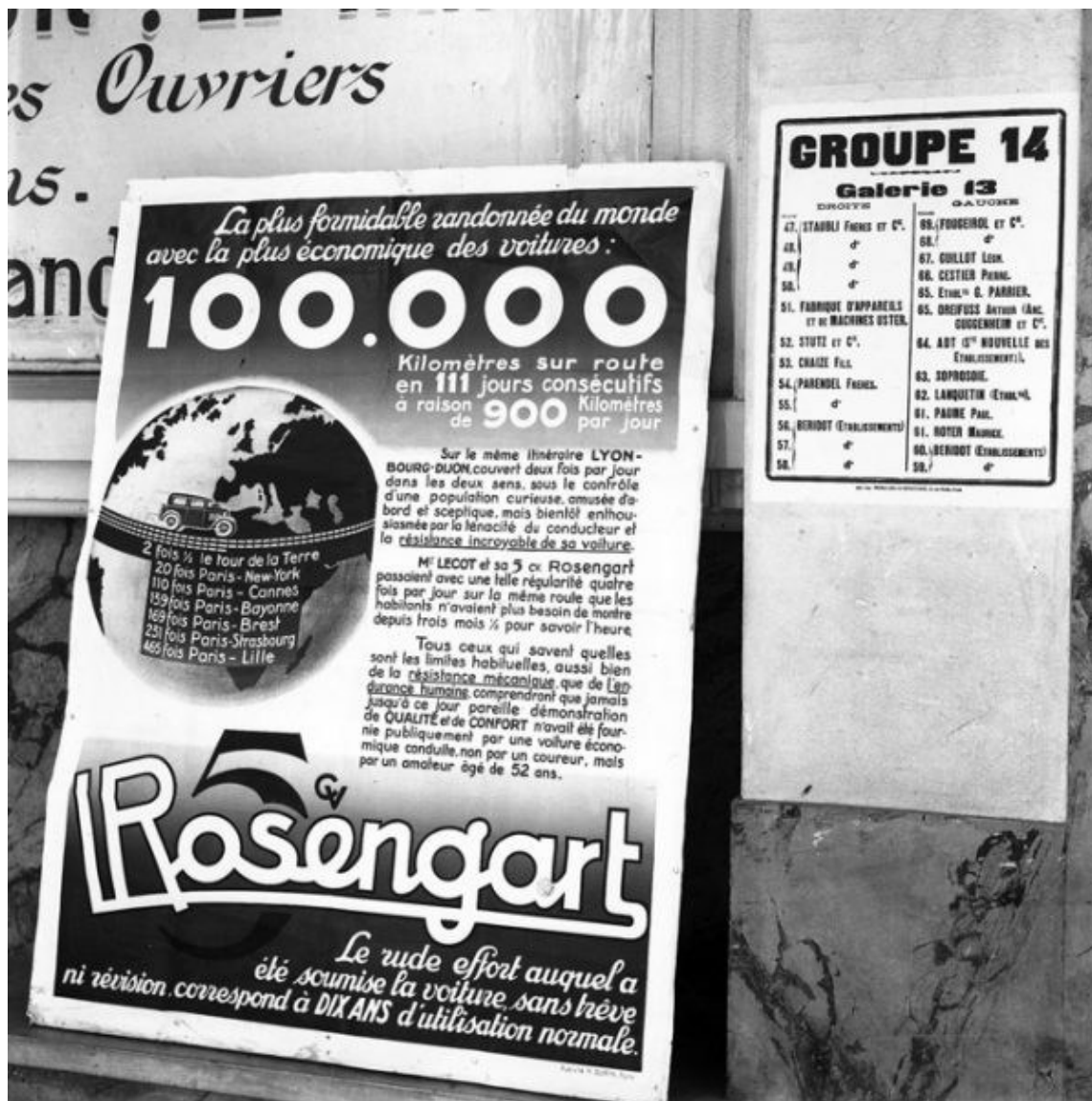
Foire de Lyon (1931) : affiche pour le Raid des 100.000 km – BM Lyon, P0546 S 1854.