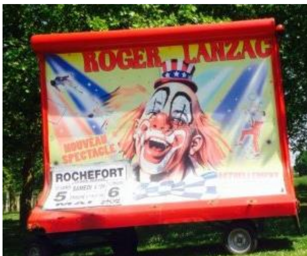
Un cirque porte son nom.

De temps en temps, il met un pied dans le monde de la radio en remplaçant Zappy Max , célébrité radiophonique des années 1950.