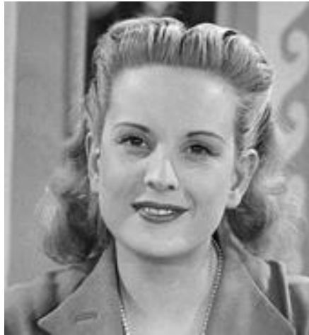
Figure emblématique des débuts de la boîte à images

Son duo mythique avec Raymond Oliver dans Art et Magie de la cuisine et sa voix inoubliable dans le générique saccadé de La Séquence du spectateur lui apportent célébrité et popularité.