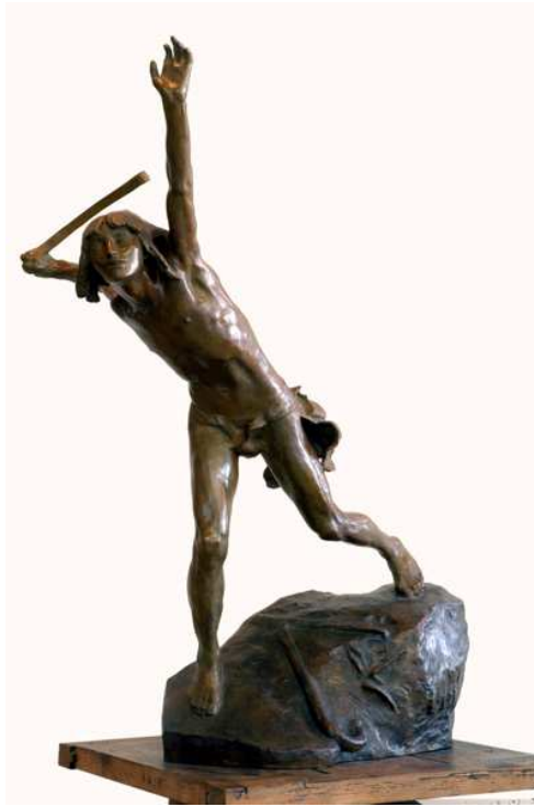
David combattant qui lui valut le Grand Prix de Rome en 1900

La célébrité lui vient dès 1909 avec une sculpture intitulée : Aux artistes dont le nom s'est perdu .