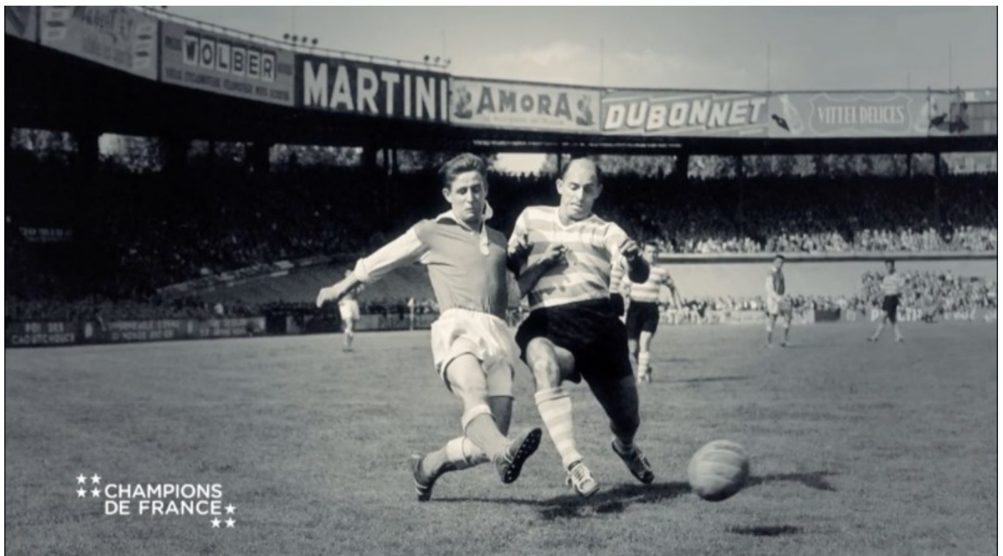
Formidable dribbleur, Kopa crée le danger dans les défenses adverses.

En août 1956, c'est au Real Madrid que Raymond Kopa vient jouer et installe sa famille dans la capitale espagnole. En même temps qu'il intègre la meilleure équipe du monde, il multiplie par dix son salaire. Il y est surnommé Kopita en raison de sa petite taille (1.68m).