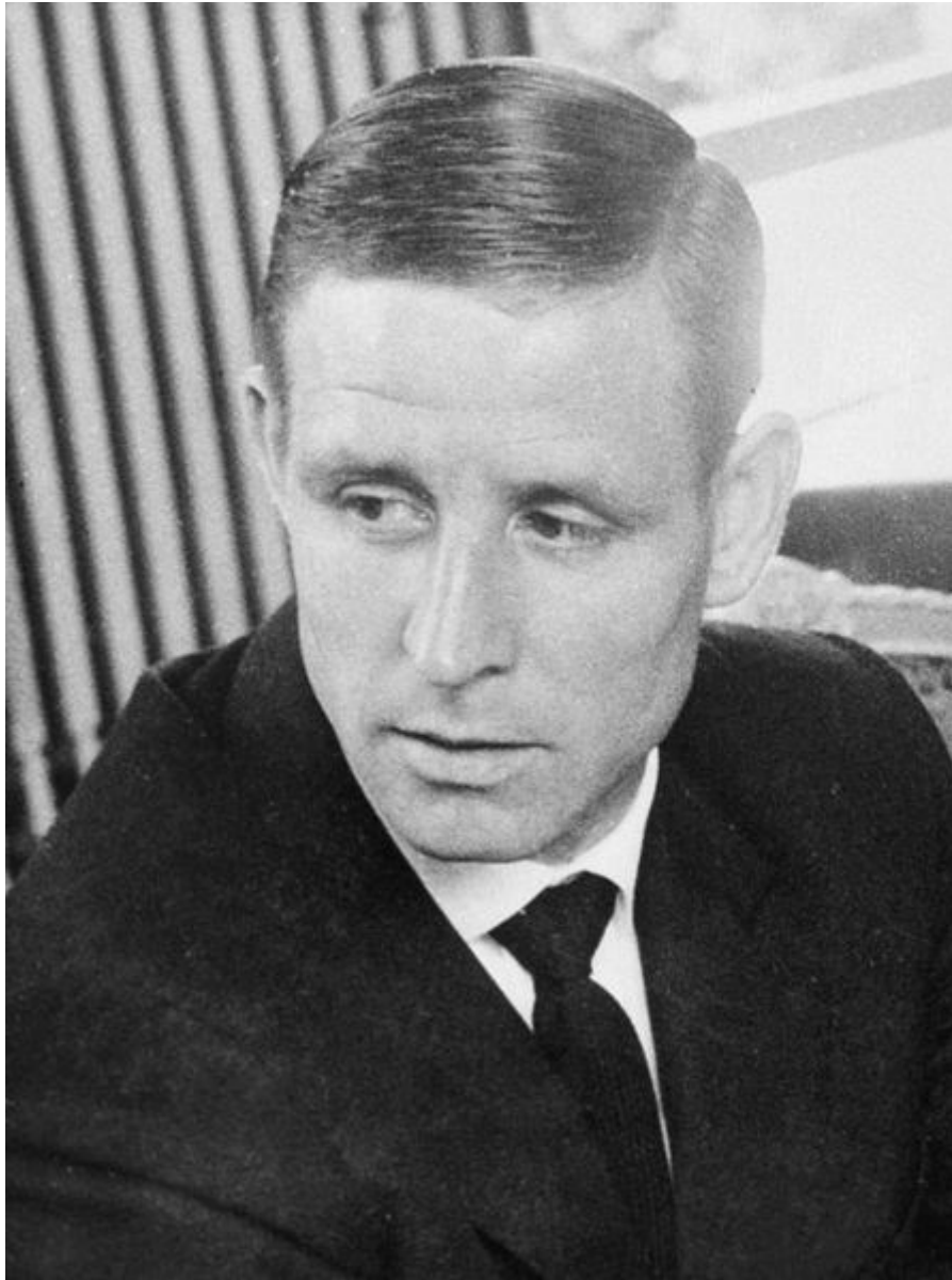
Kopa en 1963