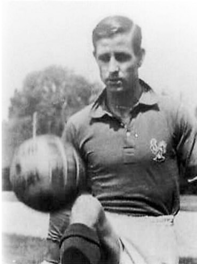
Raymond Kopa sous le maillot de l'équipe de France en 1960.

Décédé le 3 mars 2017 à Angers Maine-et-Loire 49