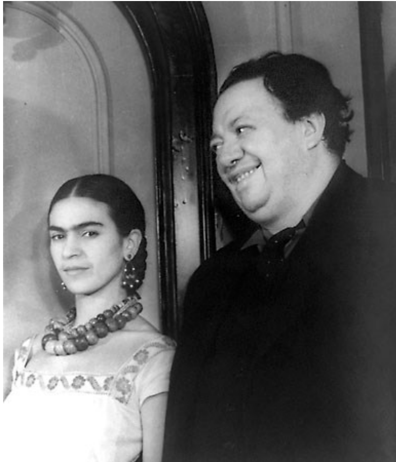
Frida Kahlo et Diego Rivera en 1932