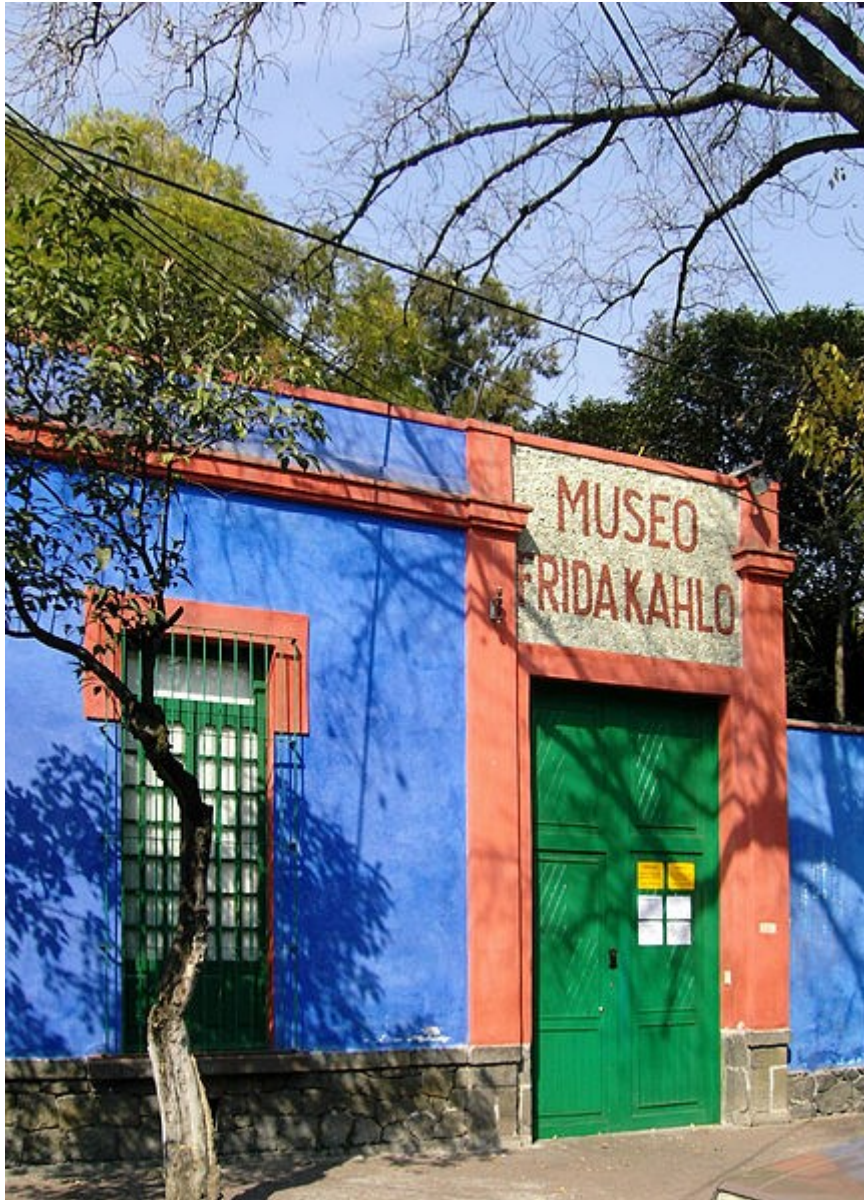
Maison natale de Frida où elle vécut et où elle mourut.

https://commons.wikimedia.org/wiki/File:Museo_Frida_Kahlo.JPG?uselang=fr