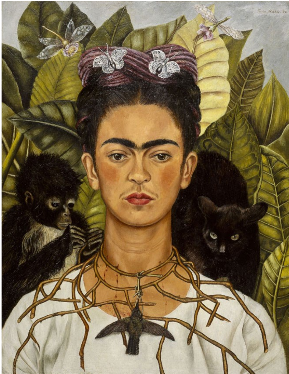
Autoportrait au collier d'épines et colibri - 1940

élément déclencheur de la série d'autoportraits qui sortiront de ses doigts artistes. En effet, sur 143 tableaux, 55 sont de ce genre.