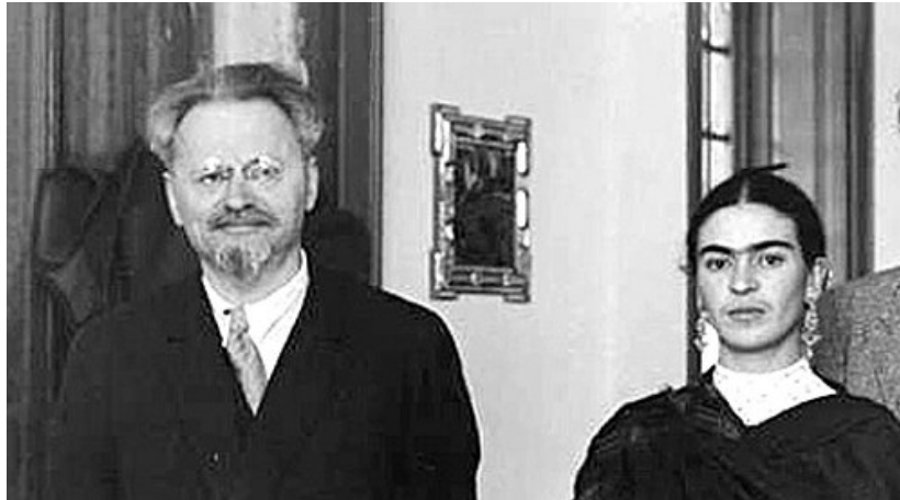
Frida Kahlo accueille Léon Trotsky

Quand Léon Trotsky et son épouse trouvent asile politique au Mexique, ils sont accueillis par Frida et Diego à la Maison bleue . Là se noue une liaison brève et passionnée entre l'artiste-peintre et le leader politique à qui elle dédicace un Autoportrait : « ... avec tout mon amour... »