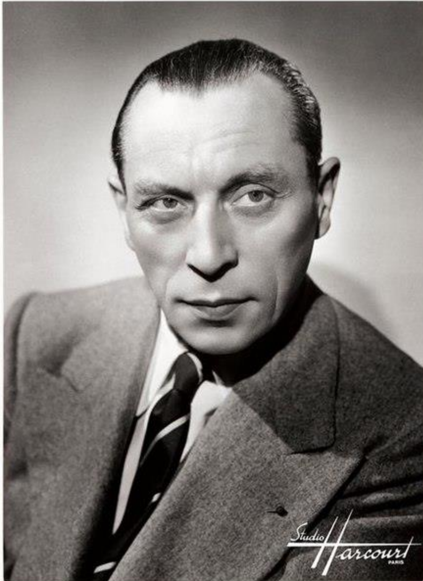
Portrait de Louis Jouvet réalisé par le studio Harcourt en 1947

Selon acte n°962 Archives de Paris en ligne – 9 D170 – vue 4/31