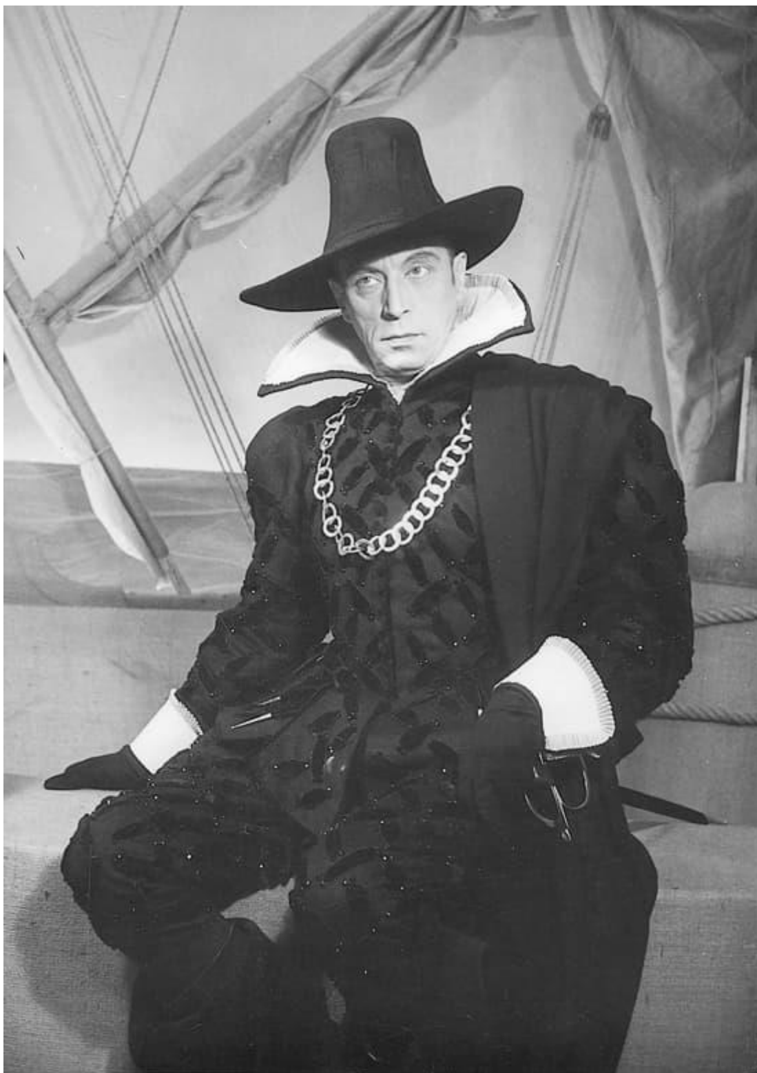
Louis Jouvet dans Dom Juan au Théâtre de l'Athénée

De 1908 à 1951, en 4 décennies de scène Louis Jouvet joue dans plus de 150 pièces de théâtre et côté cinéma, il est à l'affiche de 33 films entre 1932 et 1951.