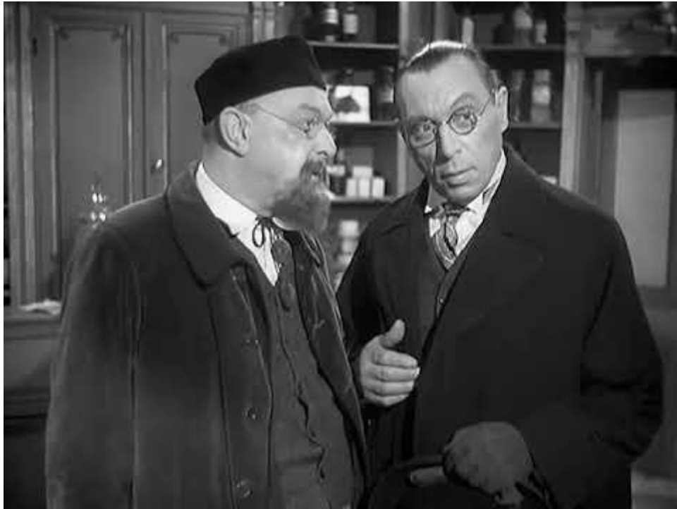
Louis Jouvet dans Dr Knock

Partenaire d' Arletty dans Hôtel du Nord , en 1938, il reçoit sa réplique fameuse : Atmosphère, atmosphère, est-ce que j'ai une gueule d'atmosphère ?