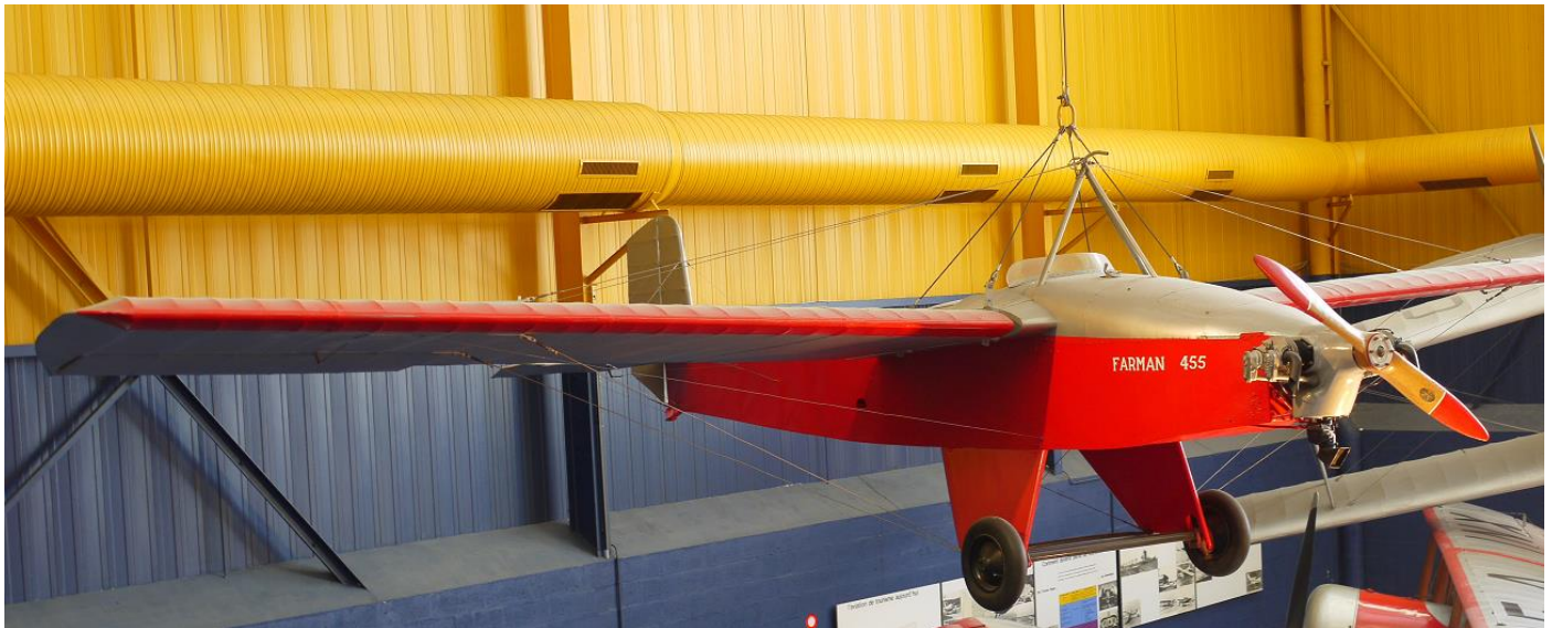
Farman-Moustique 1935 – Musée de l'Air et de l'Espace Le Bourget

Dès l'aube de la conquête de l'air et de l'espace, les femmes ont été présentes, mais il faut attendre Von-Von en 1934 pour avoir la 1 ère femme au monde pilote monitrice !