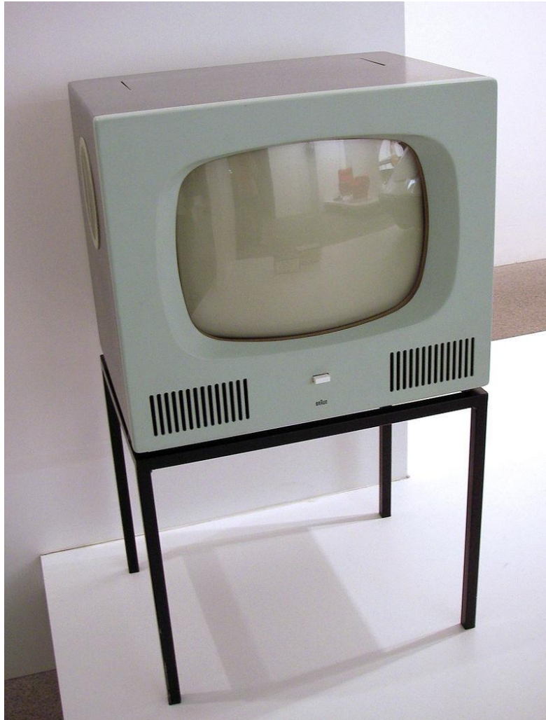
Un téléviseur de 1958

Engagée sur concours(*) le 3 mai 1949 à la télévision publique RTF (Radio Télévision Française) elle présente pour la première fois les programmes le 25 mai 1949.