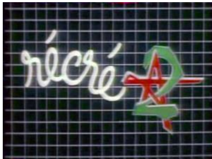
Émission pour la jeunesse, créée par Jacqueline Joubert, et qui a existé du 3 juillet 1978 au 29 juin 1988

Depuis Cannes, elle présente en 1959 et 1961, le Concours Eurovision de la Chanson ainsi que la sélection française à ce concours en 1961.