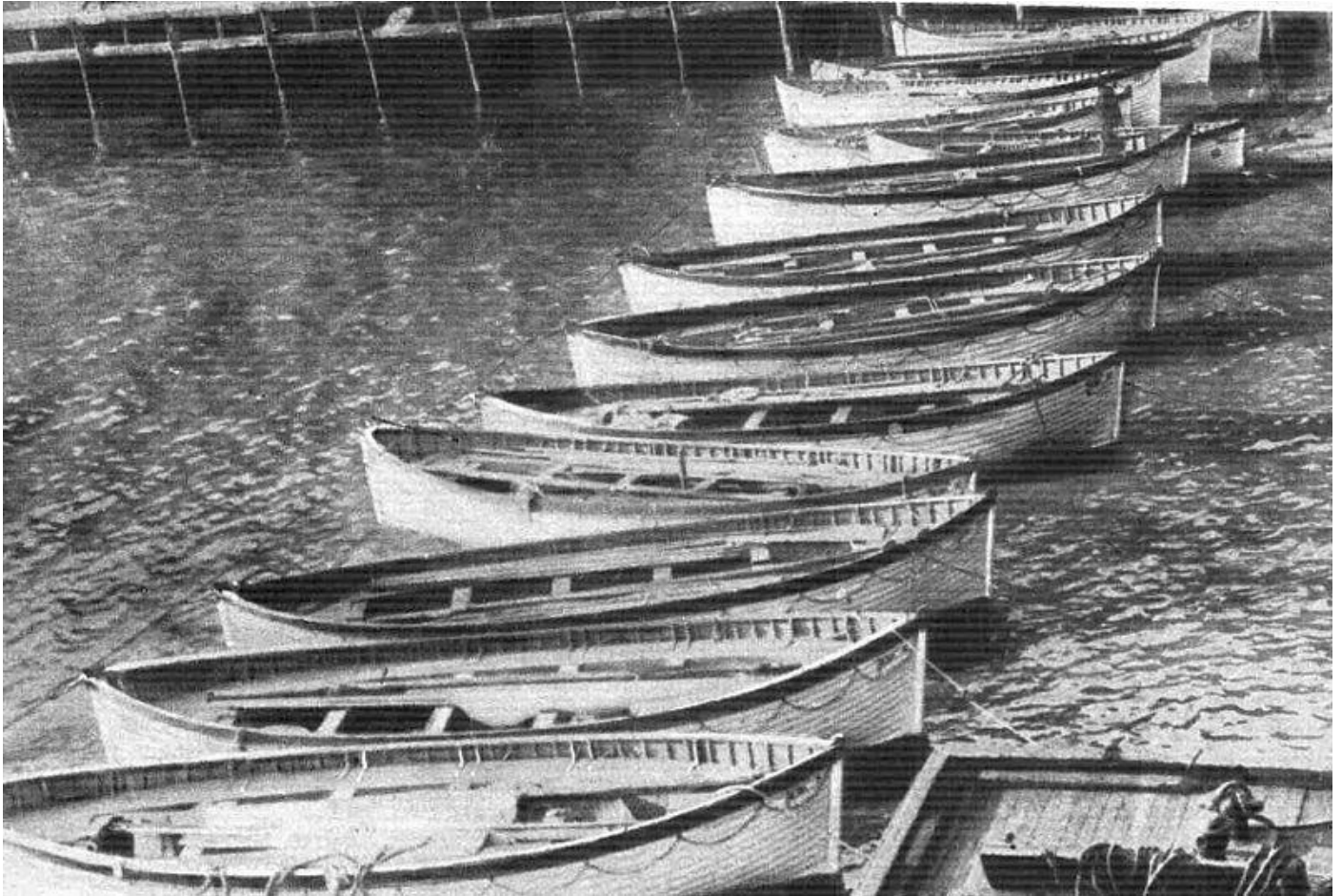
Les canots du Titanic déposés à New York fin avril 1912

Songe-t-il à son refus quand un concepteur lui avait suggéré en 1910 de mettre 64 embarcations de sauvetage au lieu des 20 prévues et dont le nombre était déjà supérieur aux normes britanniques de l'époque ?