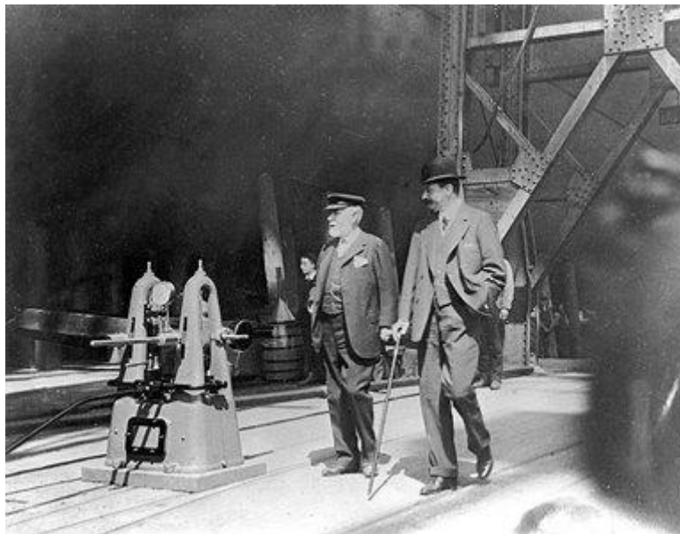
Bruce Ismay (à droite) en compagnie de William James Pirrie (homme d'affaires irlandais) lors d'une inspection du chantier du Titanic en mai 1911.

Une fois aux commandes de l'entreprise et dans la lignée de son père, Bruce Ismay décide la construction de paquebots gigantesques davantage pour le luxe et la sécurité que pour la vitesse afin d'offrir d'abord aux passagers un service régulier de qualité.