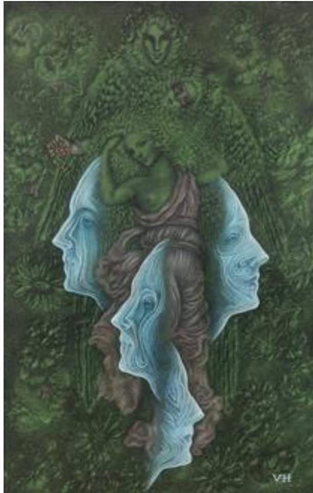
Portrait de Paul Éluard par Valentine Hugo.