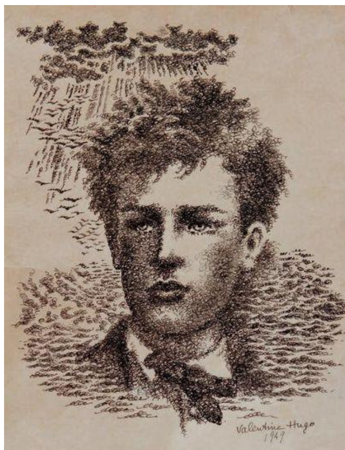
Portrait d'Arthur Rimbaud par Valentine Hugo.

Elle décède le jour de son 81 e anniversaire.