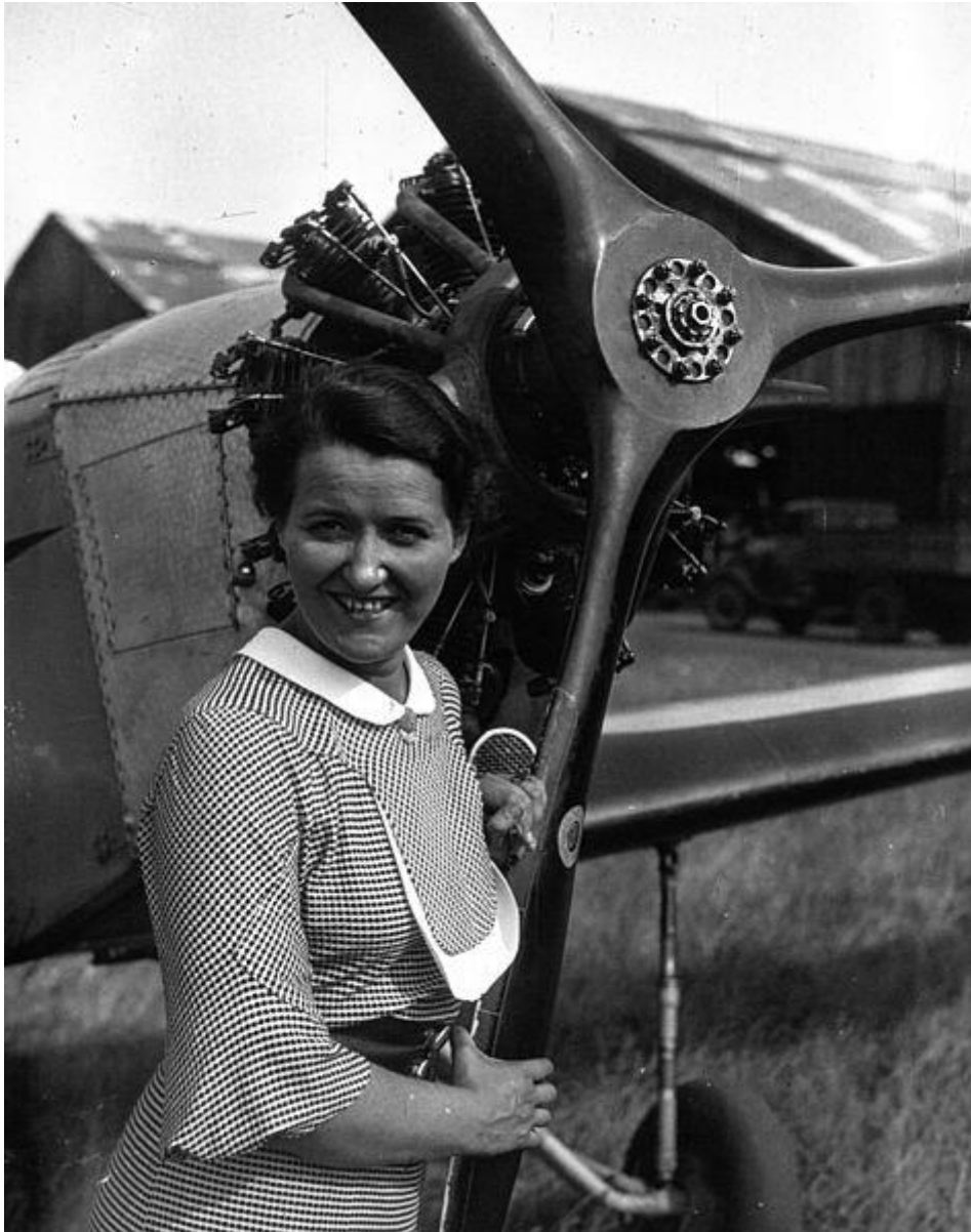
Maryse Hilsz en 1935

Quel cran faut-il à cette sportive solide et élégante aux allures de garçon manqué, pour dominer sa peur et continuer malgré plaies et bosses !