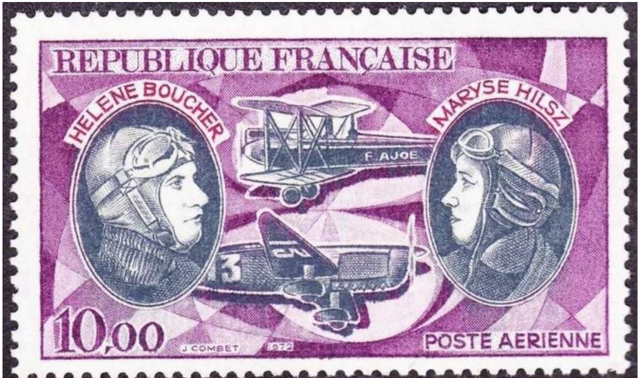
Maryse Hilsz et Hélène Boucher , deux pionnières d'exception réunies sur un timbre sorti en 1972.

Mais déjà la midinette, habile aux travaux délicats, rêve surtout d'aller plus haut, plus vite et plus loin en levant le nez au ciel dès que passe un aéroplane.