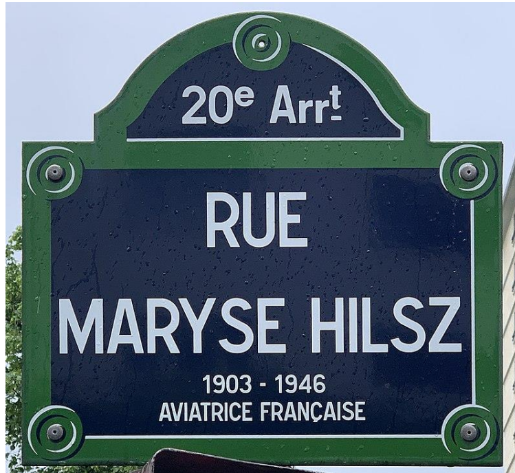
Rue Maryse Hilsz à Paris 20 e