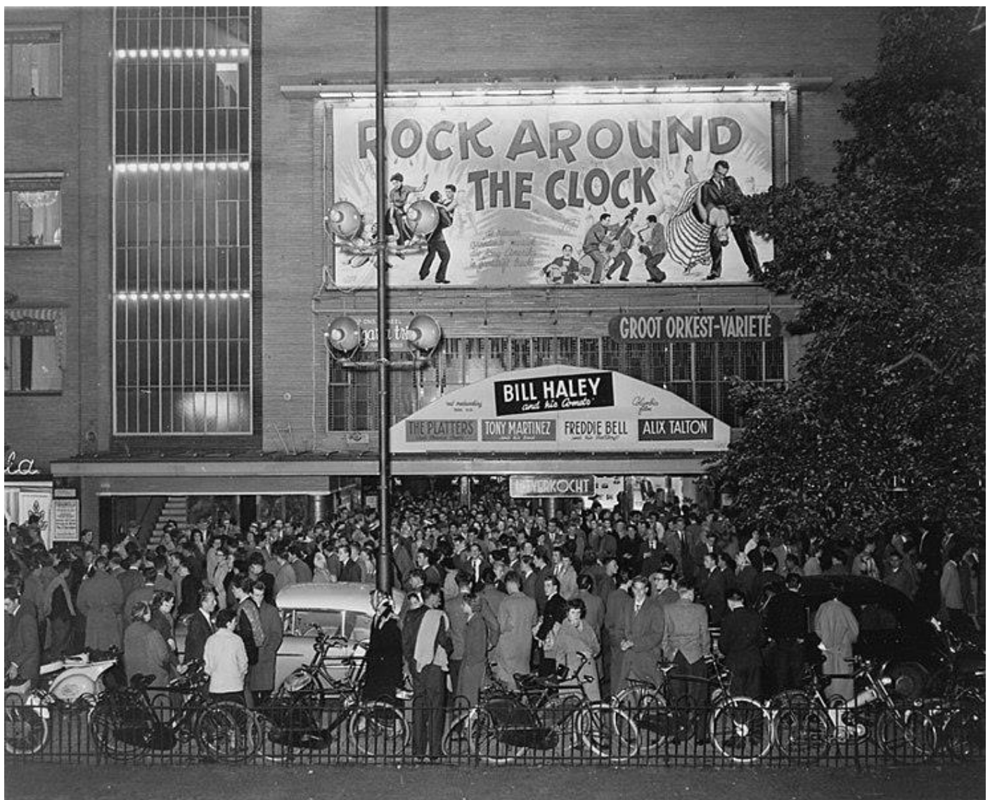
La foule à la sortie du film "Rock around the Clock" Amsterdam, 1956

https://fr.vikidia.org/wiki/Bill_Haley_%26_His_Cometes