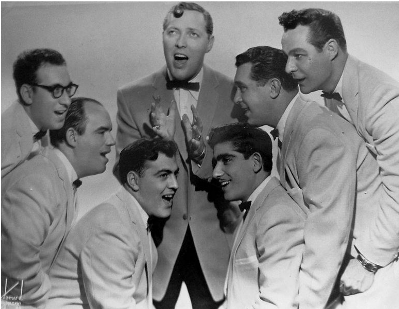
Les Comets en 1955

Haley ose le scandale de reprendre répertoire et attitudes suggestives des Afro-Américains et devient une star mondiale du rock'n'roll des années 1950.