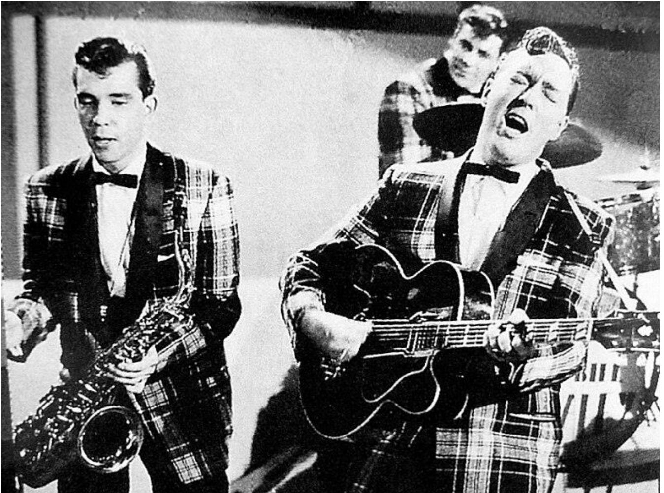
Bill Haley et les Comets (*) durant un show TV en 1955. (*) Baptisé ainsi en référence à la comète de Halley

Monument incontournable du rock, ce musicien-chanteur et enchanteur tient la scène pendant trente années et des tubes comme See You Later, Alligator, Shake, Rattle and Roll, Rocket 88 , ajouteront encore à sa célébrité.