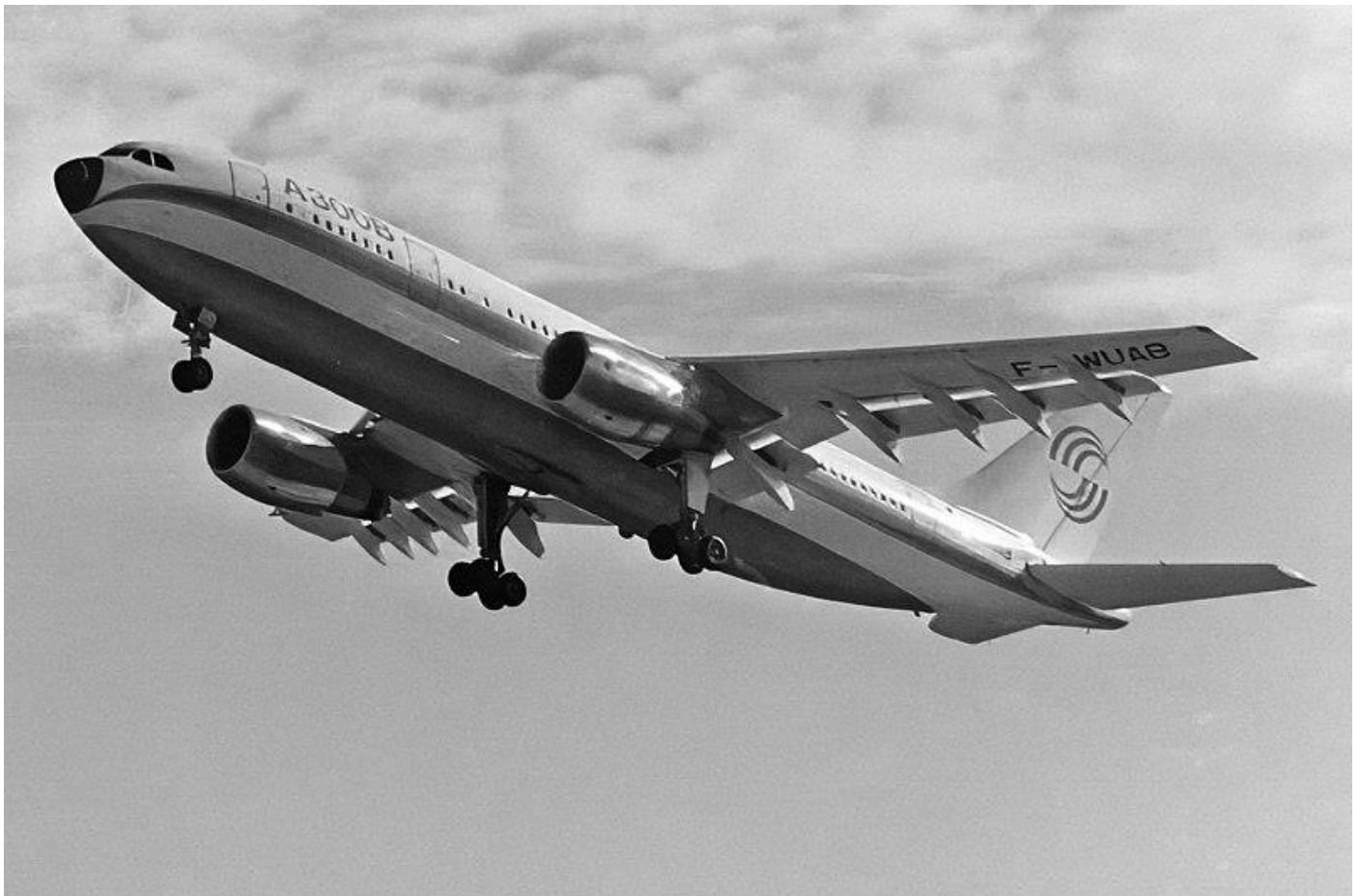
Premier vol de l'A300B le 28 octobre 1972