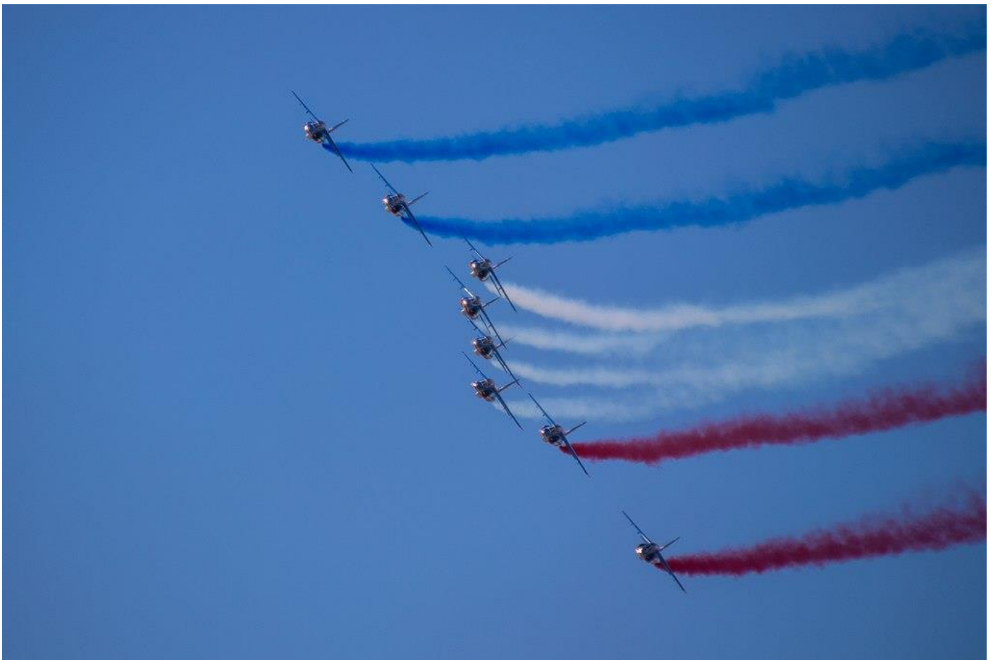
Virage de la Patrouille acrobatique de France

« On vise la perfection pour atteindre l'excellence ». Virginie Guyot